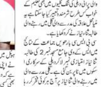
سرکاری اسکولوں کی ٹاپر تیار بنا چاہتی ہیں آئی اے ایس۔

سرکاری اسکولوں کی ٹاپر تیار بنا چاہتی ہیں آئی اے ایس۔ انہوں نے کہا کہ سرکاری اسکولوں کی ٹاپر تیار بنا چاہتی ہیں آئی اے ایس۔ انہوں نے کہا کہ سرکاری اسکولوں کی ٹاپر تیار بنا چاہتی ہیں آئی اے ایس۔ انہوں نے کہا کہ سرکاری اسکولوں کی ٹاپر تیار بنا چاہتی ہیں آئی اے ایس۔