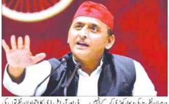
بی ایو آر ایل ڈی کا اتحاد ان فرقوں کی دہرا کر رہی ہے جبکہ ایس پی نے ایس پی دہرا کر رہی ہے۔