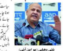
میٹھی سوڈیا نے کہا کہ تعلیم کو کبھی سیاست کا موضوع نہیں بنایا گیا۔

سیاست کر رہی ہے جب حقیقت میں تعلیم کو فروغ دینا ہمارا بنیادی ایجنڈا ہے۔ مودی حکومت کے وعدے کی جانچ پڑتال کے لیے ایک کمیٹی تشکیل دی گئی ہے۔ اس کمیٹی کے سربراہان میں جرمان پوجا باری اور چو پڑ شامل ہیں۔ ان کے ساتھ دیگر بازرگانوں کی ایک وفد بھی ہے۔ انہوں نے کہا کہ مودی حکومت کے وعدے کی جانچ پڑتال کے لیے ایک کمیٹی تشکیل دی گئی ہے۔