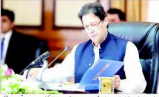
یورپی پارلیمنٹ نے اپنے ایک قرارداد میں مذہبی اقلیتوں کے ساتھ امتیازی سلوک اور ان کے حقوق کی پامالی کے خلاف ہر شے کرنا چاہئے ہے۔

لندن (ایجنسیاں) یورپی پارلیمنٹ نے 51 اراکان کی جانب سے لکھے گئے مکتوب کے مطابق اگر یورپ کی اقلیتوں کے حقوق کو یورپی کمیٹی سے اپنا رویہ تبدیل کرے تو پاکستان کے ساتھ تجارتی معاہدے منسوخ کرنے کی غرض سے اس کی کارروائی کے لیے پارلیمنٹ نے اپنے ایک قرارداد میں مذہبی اقلیتوں کے ساتھ امتیازی سلوک اور ان کے حقوق کی پامالی کے خلاف ہر شے کرنا چاہئے ہے۔ یورپی پارلیمنٹ نے اپنے ایک قرارداد میں مذہبی اقلیتوں کے ساتھ امتیازی سلوک اور ان کے حقوق کی پامالی کے خلاف ہر شے کرنا چاہئے ہے۔ یورپی پارلیمنٹ نے اپنے ایک قرارداد میں مذہبی اقلیتوں کے ساتھ امتیازی سلوک اور ان کے حقوق کی پامالی کے خلاف ہر شے کرنا چاہئے ہے۔