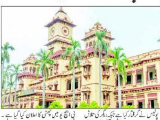
یونیورسٹی کے قتل کے واقعے کے بعد بی ایچ یو میں حالات کشیدہ ہو گئے ہیں۔ پولیس نے چار طلباء کو گرفتار کیا ہے۔

اٹھارے سالہ طالب علموں کی ہلاکت کے واقعے کے بعد بی ایچ یو میں حالات کشیدہ ہو گئے ہیں۔ پولیس نے چار طلباء کو گرفتار کیا ہے۔ یونیورسٹی کو چھاؤنی میں تبدیل کر دیا گیا ہے۔