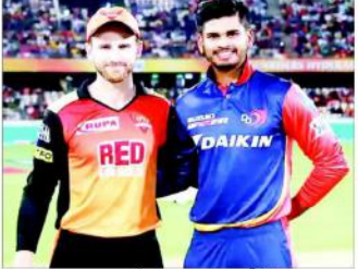
دہلی کے لیے اس کا مظاہرہ کرنے والے آئی این ایل میں سے ایک ایسے دو جوائے جاتے ہیں۔ ٹیم کے نوجوان وکٹ کیپر نے باز ریشہ پت کو بی بی ریل کو کھینچا ہوا گولڈن انڈینز کو کھیلنے کی طرح آٹھ آٹھ وارزنگ ٹاکٹ جا کر دو کچھ کچھ جتا جائے گا۔ پت نے اپنے ایک ٹکٹ دو ٹکٹوں میں بانٹ دیا ہے۔ ایک ٹکٹ کو اپنے بی بی جیکان ٹیچوں میں خود دو ٹکٹوں کو اپنے ٹکٹوں میں بانٹ دیا ہے۔