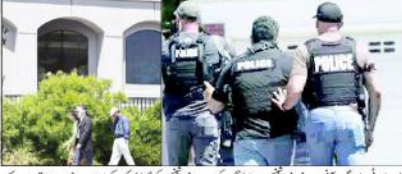
پولیس افسران کیلیفورنیا میں واقعہ کے بعد فائرنگ کے مقام پر تائب صدر کے ساتھ

تائب صدر بائیک ٹینس نے واقعے کی مذمت کرتے ہوئے اسے شیطانی اور بزدلانہ قرار دیا ہے۔ امریکی صدر ڈونلڈ ٹرمپ نے واقعے کو مذمت کرتے ہوئے کہا کہ یہودی عبادت گاہ پر حملہ ایک انتہا پسند اور بزدلانہ حرکت ہے۔