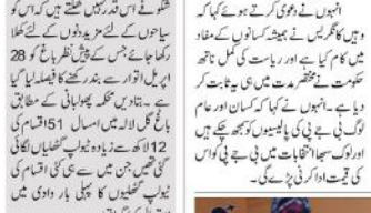
ایشیا کاسب سے بڑا باغ گل الیساواں کیلئے بند۔

ایشیا کاسب سے بڑا باغ گل الیساواں کیلئے بند۔ ایشیا کاسب سے بڑا باغ گل الیساواں کیلئے بند۔