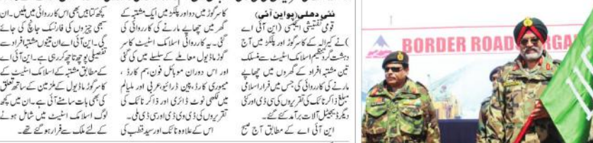
سری نگر۔ سری نگر-گمناہ کی شاہراہ کو جڑاں نکل جانے کے بعد کھول دیا گیا۔

سری نگر (ایجنسیاں)۔ سری نگر-گمناہ کی شاہراہ کو جڑاں نکل جانے کے بعد کھول دیا گیا۔ سری نگر (ایجنسیاں)۔ سری نگر-گمناہ کی شاہراہ کو جڑاں نکل جانے کے بعد کھول دیا گیا۔