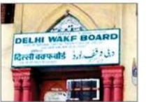
دہلی وقف بورڈ کی عمارت، نئی دہلی۔

اماموں اور موزنوں میں خوشی کا ماحول، انہوں نے دہلی وقف بورڈ کے ذمہ داران کا ادا کیا شکریہ