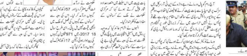
رام گوپال وری ماپولیس حراست میں۔

رام گوپال وری ماپولیس حراست میں۔ رام گوپال وری ماپولیس حراست میں۔ رام گوپال وری ماپولیس حراست میں۔