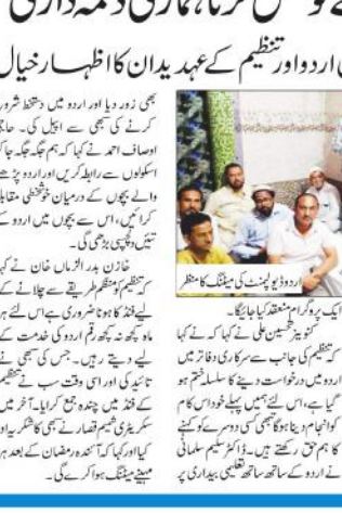
ایس ڈی ایم کے میمورنڈم پر تبادلہ خیال کرنے والے لوگوں کی ایک گروپ...