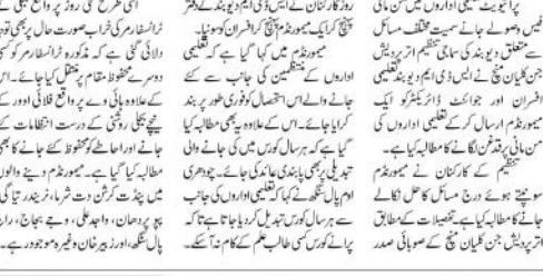
ایس ڈی ایم کے میمورنڈم پر تبادلہ خیال کرنے والے لوگوں کی ایک گروپ...