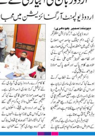
ایس ڈی ایم کے میمورنڈم پر تبادلہ خیال کرنے والے لوگوں کی ایک گروپ...