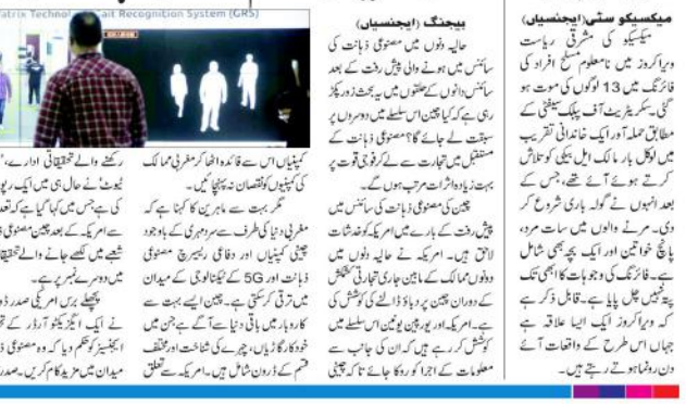
چین کی مصنوعی ذہانت کی برتری میں مصنوعی ذہانت کی معاونت

بیجنگ (ایجنسیاں) چین کی مصنوعی ذہانت کی برتری میں مصنوعی ذہانت کی معاونت سے چین کی برتری میں معاونت ہے۔