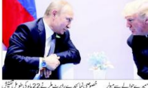
ڈونلڈ ٹرمپ اور ولادیمیر پوتن کے ملاقات کے دوران

واشنگٹن (اسوسیوٹک) امریکی بیورو آف نیوز نے کہا ہے کہ ٹرمپ اور پوتن کے درمیان ملاقات کے دوران ٹرمپ نے پوتن کو انتخابات میں مداخلت کرنے کے حوالے سے رپورٹیں فراہم کرنے سے منع کیا۔