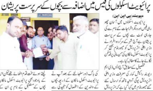
پرائیویٹ اسکولوں کی فیس میں اضافے سے بچوں کے سہ پریشاں

حفاظت کرام کی دستار بندی کیلئے تقریب کا انعقاد پرائیویٹ اسکولوں کی فیس میں اضافے سے بچوں کے سہ پریشاں پرائیویٹ اسکولوں کی فیس میں اضافے سے بچوں کے سہ پریشاں۔ پرائیویٹ اسکولوں کی فیس میں اضافے سے بچوں کے سہ پریشاں۔ پرائیویٹ اسکولوں کی فیس میں اضافے سے بچوں کے سہ پریشاں۔