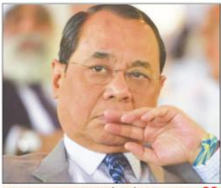
اس کے پیچھے کوئی بڑی طاقت پوشیدہ ہے۔ تنازعہ کے پیچھے چھپے ہوئے لوگ چیف جسٹس کے دفتر کو فعال بنا رہے ہیں۔

چیف جسٹس پر الزامات بے بنیاد: بار کونسل نئی دہلی (بی این این) بار کونسل نے چیف جسٹس کے خلاف عسلی برائیوں کے الزامات کو بے بنیاد قرار دیا ہے۔ انہوں نے کہا کہ چیف جسٹس کے خلاف عسلی برائیوں کے الزامات کو بے بنیاد قرار دیا ہے۔ انہوں نے کہا کہ چیف جسٹس کے خلاف عسلی برائیوں کے الزامات کو بے بنیاد قرار دیا ہے۔