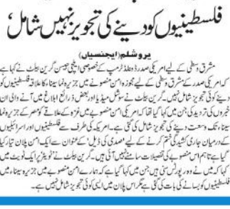
امریکی امن پلان میں فلسطینیوں کو دینے کی تجویز نہیں شامل

یروشلیم (ایجنسیاں) امریکہ کی امن پلان میں فلسطینیوں کو دینے کی تجویز نہیں شامل ہے۔