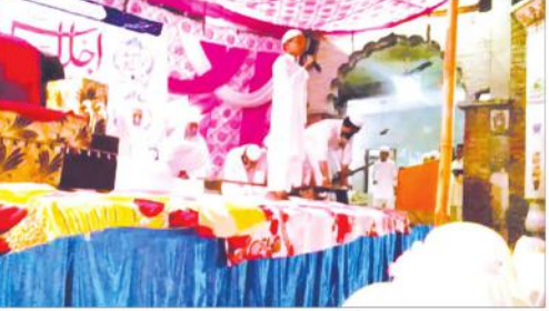
تفصیلی حفظ کے موقع پر پروگرام کا منظر

ایس ڈی ایم کے ممبران اور سڑک تعمیر کرنے والی کمپنی کے خلاف تحریک چلائی جائے گی۔ ایک سال کا عرصہ ہوئے ہیں لیکن کوئی کام نہیں ہو سکا۔ سڑک تعمیر کرنے والی کمپنی نے کوئی کام نہیں کیا۔ سڑک تعمیر کرنے والی کمپنی نے کوئی کام نہیں کیا۔ سڑک تعمیر کرنے والی کمپنی نے کوئی کام نہیں کیا۔