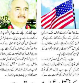
خلیفہ حقیر کی خدمات قابل تحسین

دہلی (ایجنسیاں) امریکہ نے خلیفہ حقیر کی خدمات قابل تحسین قرار دی ہیں۔ ان کے خیال میں خلیفہ حقیر نے دہشت گردی کیخلاف جنگ میں نمایاں خدمات انجام دی ہیں۔