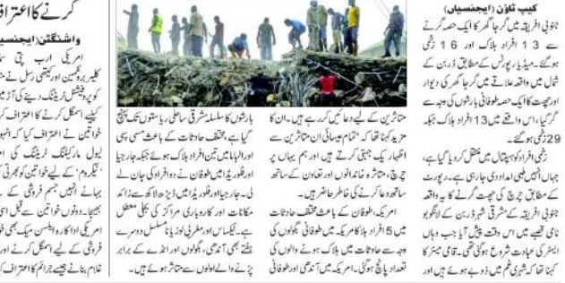
گرجا گھر کا ایک حصہ گرنے سے 13 افراد ہلاک

کلب ٹاؤن (ایجنسیاں) ڈوبی ٹریڈ میں گرجا گھر کا ایک حصہ گرنے سے 13 افراد ہلاک اور 6 زخمی ہو گئے۔ پولیس نے علاقے میں سیکورٹی کا عمل کر رہا ہے۔