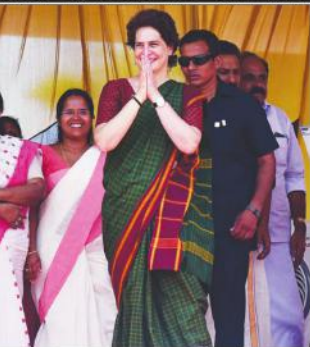
دانا ڈی میں راجہ کوٹھڑی کے جج جی پریٹھوی کی آمد کے دوران

سازش کے پیچھے کسی بڑی طاقت کا ہاتھ • عدالت کو بیباک بنا دیا جا سکتا • آئینی اداروں کی شہ پر مسخ کرنے کی کوشش