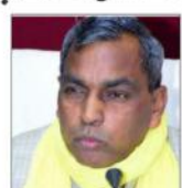
ایس بی ایس پی لیڈر