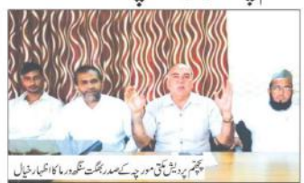
گروہ کی تصویر