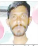
ایک شخص کی تصویر