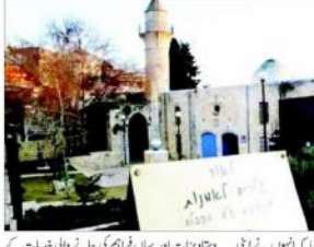
اسرائیلی حکام نے مسجد فلسطین کے علاقے میں قائم تاریخی مسجد میخانے میں تبدیل کرنے کی تیاریاں کر رہے ہیں۔

غزہ (ایجنسیاں) اسرائیلی حکام نے مسجد فلسطین کے علاقے میں قائم تاریخی مسجد میخانے میں تبدیل کرنے کی تیاریاں کر رہے ہیں۔