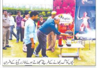
گروہ کی تصویر