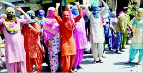
بی جے پی کے خلاف کسانوں کی ایک بڑی تحریک شروع ہوئی ہے۔