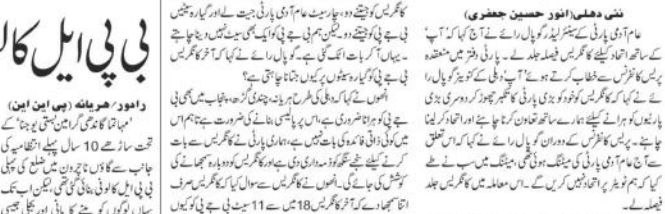
بی جے پی کے خلاف کسانوں کی ایک بڑی تحریک شروع ہوئی ہے۔

ہم ٹوٹی پرنسپل کریں گے اتحاد، کانگریس جلد فیصلہ: گوپال رائے۔ بی جے پی کے خلاف کسانوں کی ایک بڑی تحریک شروع ہوئی ہے۔