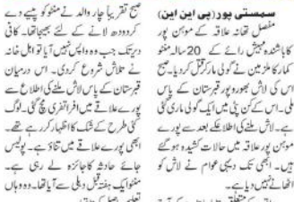
مختصر مختصر۔ ایک نوجوان کو گولی مار کر قتل کیا گیا۔ حالات کشیدہ ہیں۔