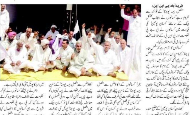
بی جے پی کے خلاف کسانوں کی ایک بڑی تحریک شروع ہوئی ہے۔

بی جے پی کے نام پر مرکزی حکومت نے کسانوں کے ساتھ کیا ہے بڑا گھونالہ۔ کسانوں کا مظاہرہ اور حکومت کو نقصان پہنچانے کے لیے بی جے پی کے خلاف کسانوں کی ایک بڑی تحریک شروع ہوئی ہے۔ بی جے پی کے خلاف کسانوں کی ایک بڑی تحریک شروع ہوئی ہے۔ بی جے پی کے خلاف کسانوں کی ایک بڑی تحریک شروع ہوئی ہے۔