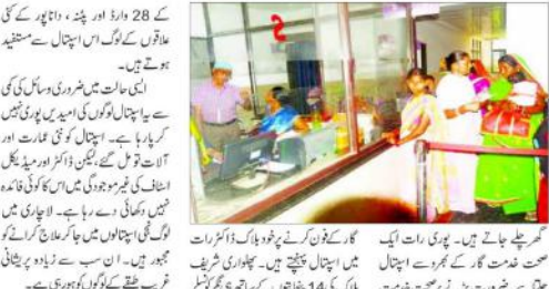
صحت خدمتگار کے رحم و کرم پر ایمر جنسی خدمات۔ ایک نوجوان کو گولی مار کر قتل کیا گیا۔ حالات کشیدہ ہیں۔

بھلا شریف (بی بی این) صحت خدمتگار کے رحم و کرم پر ایمر جنسی خدمات۔ ایک نوجوان کو گولی مار کر قتل کیا گیا۔ حالات کشیدہ ہیں۔