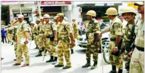
پتھہ (بی این این) لوک سبھا الیکشن کے لئے نیم فوجی دستوں کی کمپنیاں بہار راجھ کی ایک ایک بھارتی فوجی دستوں کی 104 کمپنیاں تعینات کی گئی ہیں۔ ان کمپنیوں کے ساتھ ساتھ ایک ایک بھارتی فوجی دستوں کی 104 کمپنیاں تعینات کی گئی ہیں۔ ان کمپنیوں کے ساتھ ساتھ ایک ایک بھارتی فوجی دستوں کی 104 کمپنیاں تعینات کی گئی ہیں۔