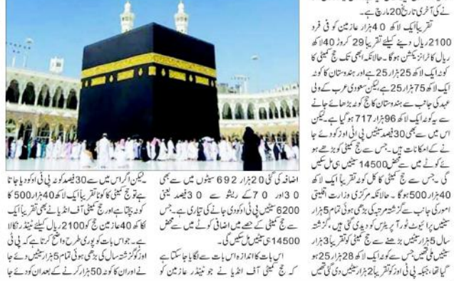
حج کیلئے ایک لاکھ 40 ہزار عازمین کیلئے ایک لاکھ 40 ہزار ڈالر کی غیر ملکی کرنسی میٹڈر جمع کرنے کی آخری تاریخ 20 مارچ 2019ء مقرر کی ہے۔

حج کمیٹی آف انڈیا نے ایک لاکھ 40 ہزار عازمین کیلئے ایک لاکھ 40 ہزار ڈالر کی غیر ملکی کرنسی میٹڈر جمع کرنے کی آخری تاریخ 20 مارچ 2019ء مقرر کی ہے۔ حج کمیٹی آف انڈیا نے ایک لاکھ 40 ہزار عازمین کیلئے ایک لاکھ 40 ہزار ڈالر کی غیر ملکی کرنسی میٹڈر جمع کرنے کی آخری تاریخ 20 مارچ 2019ء مقرر کی ہے۔ حج کمیٹی آف انڈیا نے ایک لاکھ 40 ہزار عازمین کیلئے ایک لاکھ 40 ہزار ڈالر کی غیر ملکی کرنسی میٹڈر جمع کرنے کی آخری تاریخ 20 مارچ 2019ء مقرر کی ہے۔