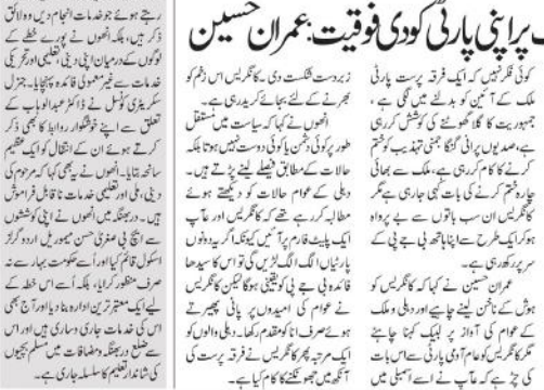
انگلینڈ نے ملک پر اپنی پارٹی کو دی فوقیت: عمران حسین۔