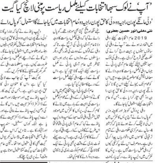
آپ نے لوگ سبھا انتخابات کیلئے مکمل ریاست پوٹنی لانچ کیا گیٹ۔