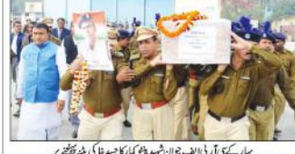
پہاڑیوں کی طرف سے ہندوؤں کو مارنے کا واقعہ

ایبٹ آباد کی طرح بالاکوٹ کے حملے کے ثبوت پیش ہوں۔ ایبٹ آباد کی طرح بالاکوٹ کے حملے کے ثبوت پیش ہوں۔