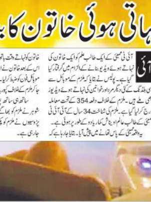
ایک طالب علم کو ایک خاتون کی ویڈیو دکھائی جس میں وہ ایک لڑکی کو گھر میں لے جاتا ہے۔

نہا تھی ہوئی خاتون کا بنا لیا ویڈیو آئی ٹی ایجنسی نے ایک طالب علم کو ایک خاتون کی ویڈیو دکھائی جس میں وہ ایک لڑکی کو گھر میں لے جاتا ہے۔ اس ویڈیو میں وہ لڑکی کو گھر میں لے جاتا ہے۔ اس ویڈیو میں وہ لڑکی کو گھر میں لے جاتا ہے۔