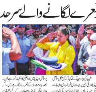
ایبٹ آباد میں نوجوانوں کے گنگہ گاروں کو جلد پھانسی دو

نوجوانوں کے گنگہ گاروں کو جلد پھانسی دو: ایبٹ آباد ایبٹ آباد میں نوجوانوں کے گنگہ گاروں کو جلد پھانسی دو۔