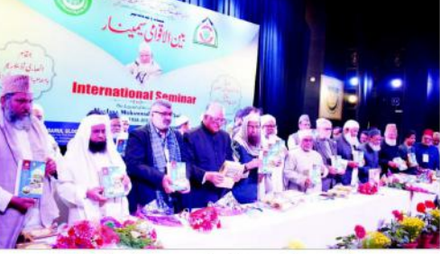
مولانا محمد سالم قاسمی کے افکار پر مبنی ملت کی شیرازہ بندی

جنوب مشرقی دہلی سے عام آدی پارٹی نے لائق فائق اور صدہ امیدوار کیا ہے۔ منتخب، ضیاء چوہدری