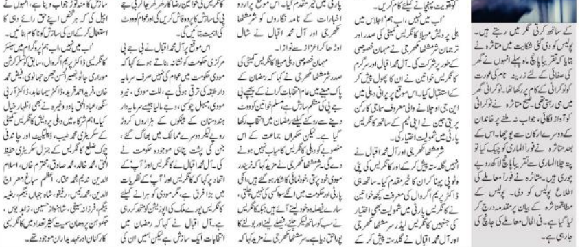
منشی دہلی (انور حسین جھڑی) نے کانگریس کے ساتھ نہیں بننے کے لئے لوگ سمجھا کی بات چیت میں سے چھ پر امیدوار کھینچ لیے ہیں۔

منشی دہلی (انور حسین جھڑی) منشی دہلی نے کانگریس کے ساتھ نہیں بننے کے لئے لوگ سمجھا کی بات چیت میں سے چھ پر امیدوار کھینچ لیے ہیں۔ لیکن دہلی میں کانگریس کے ساتھ اتحاد کے لئے عام آدمی پارٹی کے لیڈر مسلسل کہہ رہے ہیں۔ کانگریس کی تقویت کیلئے اب میں نہیں، اب ہم اجلاس کا انعقاد۔ منشی دہلی نے کانگریس کے ساتھ نہیں بننے کے لئے لوگ سمجھا کی بات چیت میں سے چھ پر امیدوار کھینچ لیے ہیں۔ لیکن دہلی میں کانگریس کے ساتھ اتحاد کے لئے عام آدمی پارٹی کے لیڈر مسلسل کہہ رہے ہیں۔