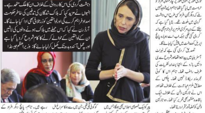
نیوزی لینڈ کے شہر کرائسٹ چرچ کی دو ماہ پہلے ہوئی دہشت گردی کے واقعے کا ایک اور پہلو اب سامنے آ رہا ہے۔

نیوزی لینڈ کے شہر کرائسٹ چرچ کی دو ماہ پہلے ہوئی دہشت گردی کے واقعے کا ایک اور پہلو اب سامنے آ رہا ہے۔ مغربی ممالک میں مسلمان برادری پر ہونے والے حملے کی تعداد میں اضافہ ہو گیا ہے۔ مغربی ممالک میں مسلمان برادری پر ہونے والے حملے کی تعداد میں اضافہ ہو گیا ہے۔ مغربی ممالک میں مسلمان برادری پر ہونے والے حملے کی تعداد میں اضافہ ہو گیا ہے۔ مغربی ممالک میں مسلمان برادری پر ہونے والے حملے کی تعداد میں اضافہ ہو گیا ہے۔ مغربی ممالک میں مسلمان برادری پر ہونے والے حملے کی تعداد میں اضافہ ہو گیا ہے۔