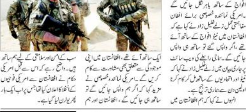
امریکی فوجیوں نے افغانستان سے نیو افواج کے ساتھ نکلنے کا اعلان کیا۔

امریکہ نے افغانستان سے نیو افواج کے ساتھ نکلنے کا اعلان کیا۔ امریکہ نے افغانستان سے نیو افواج کے ساتھ نکلنے کا اعلان کیا۔