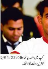
کپ میں صدارتی تمغہ کے ساتھ ساتھ...

چوٹ کے سبب سی فائل نہیں کھیل پائے میڈل کے لیے کئی کھلاڑیوں کو منتخب کیا گیا ہے۔ چوٹ کے سبب سی فائل نہیں کھیل پائے میڈل کے لیے کئی کھلاڑیوں کو منتخب کیا گیا ہے۔