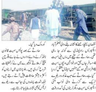
بلوچستان میں ریلوے ٹریک پر دھماکہ کے بعد متاثرہ علاقوں میں لوگوں کو تلاش کرنے میں مصروف ہیں۔

بلوچستان (ایجنسیاں) - بلوچستان میں ریلوے ٹریک پر دھماکہ ہوا، 4 افراد جاں بحق ہوئے۔ بلوچستان میں ریلوے ٹریک پر دھماکہ ہوا، 4 افراد جاں بحق ہوئے۔ بلوچستان میں ریلوے ٹریک پر دھماکہ ہوا، 4 افراد جاں بحق ہوئے۔