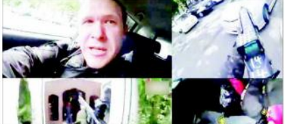
کرائسٹ چرچ (نیوزی لینڈ) میں نیوزی لینڈ کے کرائسٹ چرچ میں ہونے والے حملے کے دوران ایک شخص کی لاشیں دکھائی دے رہی ہیں۔

آرڈن نے پش کاؤنٹری میں کہا ہے کہ حملہ آور ریگن کی فریڈ کوہاسٹ میں سٹیٹ کیونٹی کے درمیان مارے گئے لوگوں کو پھیلانے میں مددگار بن گئے۔ ان کے ساتھ ساتھ 6 ہندوستانی لوگوں کی جاں بحق ہوئی۔ ان میں سے 3 ہندوستانی اور 3 نیوزی لینڈی تھے۔ ان کے ساتھ ساتھ 6 ہندوستانی لوگوں کی جاں بحق ہوئی۔ ان میں سے 3 ہندوستانی اور 3 نیوزی لینڈی تھے۔ ان کے ساتھ ساتھ 6 ہندوستانی لوگوں کی جاں بحق ہوئی۔ ان میں سے 3 ہندوستانی اور 3 نیوزی لینڈی تھے۔