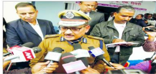
بہار کے ڈی جی بی کی ٹیم نے ہولی پر انتظامات کے لیے ایک ہزار سے زائد سپاہیوں کو چھتہ کرنے میں مدد کی ہے۔ ان کے ساتھ ساتھ پولیس اور دیگر اہلکار بھی موجود ہیں۔ ان کے ہاتھ میں گولہ باریک اور دیگر ہتھیار بھی ہیں۔

بہار کے ڈی جی بی کی ٹیم نے ہولی پر انتظامات کے لیے ایک ہزار سے زائد سپاہیوں کو چھتہ کرنے میں مدد کی ہے۔ ان کے ساتھ ساتھ پولیس اور دیگر اہلکار بھی موجود ہیں۔ ان کے ہاتھ میں گولہ باریک اور دیگر ہتھیار بھی ہیں۔ ان کے ساتھ ساتھ پولیس اور دیگر اہلکار بھی موجود ہیں۔ ان کے ہاتھ میں گولہ باریک اور دیگر ہتھیار بھی ہیں۔