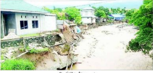
سیلاب سے متاثرہ علاقہ کا ایک منظر۔