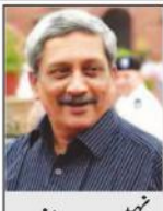
پارکیر، طویل بیماری کے بعد انتقال

مسعود اظہر کا معاملہ حل ہو جائے گا: چین۔ پاکستانی سفارت خانے کی طرف سے درخواست کی جا رہی ہے۔