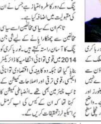
چینی تو انائی ایجنسی کے سربراہ پارٹی سے برخاست ہوئے۔

چینی تو انائی ایجنسی کے سربراہ پارٹی سے برخاست ہوئے۔ چینی تو انائی ایجنسی کے سربراہ پارٹی سے برخاست ہوئے۔