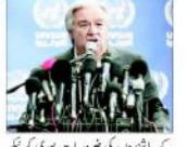
اسرائیلی اتھارٹی کے سربراہ۔

تھابہ (ایجنسیاں) - اسرائیل اور فلسطینی اتھارٹی غزہ کی امداد میں نڈائیں رکاوٹ بن رہی ہیں۔ اسرائیل اور فلسطینی اتھارٹی غزہ کی امداد میں نڈائیں رکاوٹ بن رہی ہیں۔ اسرائیل اور فلسطینی اتھارٹی غزہ کی امداد میں نڈائیں رکاوٹ بن رہی ہیں۔