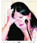
پنچا پیر (ایجنسیاں) - محکمہ آب و ہوا نے پینچا پیر کے علاقے کو انضمام کرنے کا فیصلہ کیا ہے۔

پنچا پیر (ایجنسیاں) - محکمہ آب و ہوا نے پینچا پیر کے علاقے کو انضمام کرنے کا فیصلہ کیا ہے۔ اس کے تحت 106 کروڑ روپے لگھوٹالہ کا انضمام کیا جائے گا۔ محکمہ آب و ہوا نے پینچا پیر کے علاقے کو انضمام کرنے کا فیصلہ کیا ہے۔ اس کے تحت 106 کروڑ روپے لگھوٹالہ کا انضمام کیا جائے گا۔