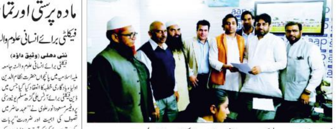
پروفیسر فیڈریشن کے وفد کی ممبر اسمبلی سے ملاقات

فیصلہ برائے انسانی علم و دانش جامعہ اسلامیہ کے زیر اہتمام پانچویں روزانہ تصوف کا انعقاد نئی دہلی (ایس این این)۔ ایک سماجی تنظیم نے نئی دہلی میں ایم اے کے لیے کام کرنے والوں کو مبارکباد دی ہے۔ ان کے کام کرنے والوں کو مبارکباد دی ہے۔ ان کے کام کرنے والوں کو مبارکباد دی ہے۔ ان کے کام کرنے والوں کو مبارکباد دی ہے۔