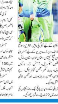
آسٹریلیا اور پاکستان کے درمیان سیریز کیلئے دونوں ٹیموں کا اعلان

آسٹریلیا اور پاکستان کے درمیان سیریز کیلئے دونوں ٹیموں کا اعلان آسٹریلیا اور پاکستان کے درمیان سیریز کیلئے دونوں ٹیموں کا اعلان