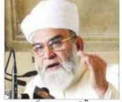
منشی دہلی، بی این این

مسلمان تو ہر طرح سے چکدار رویے کا مظاہرہ کر رہا ہے مگر ہندو فریق اپنے مطالبے پر اڑے ہیں