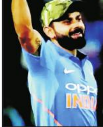
پکتان ایرون فنج اور عثمان خواجہ کی تاریخی شراکت داری کی بدولت آسٹریلیا نے کی سیریز میں شاندار اوپنر

عثمان خواجہ اور پکتان ایرون فنج کی تاریخی شراکت داری کی بدولت آسٹریلیا نے کی سیریز میں شاندار اوپنر