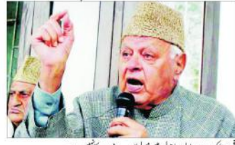
سری نگر (ایجنسیاں) - مسیحی کاؤنٹرس کے سربراہ فاروق عبداللہ نے اپنے تین مسلمان خلیفہ کا حواس کر رہے ہیں۔ انہوں نے کہا کہ مسیحیوں نے اپنے تین مسلمان خلیفہ کا حواس کر رہے ہیں۔

سری نگر (ایجنسیاں) - مسیحی کاؤنٹرس کے سربراہ فاروق عبداللہ نے ملک کے عداوت پر فخر کا اظہار کیا ہے۔ انہوں نے کہا ہے کہ مسیحیوں کو مسیحیوں کی طرف سے مختلف مذاہب کے درمیان خلیج پیدا کر رہی ہے۔ اپنے تین مسلمان خلیفہ کا حواس کر رہے ہیں۔ فاروق عبداللہ نے بیان کیا کہ مسیحیوں نے اپنی شہرت کے لیے کوئی قدم نہیں اٹھایا ہے۔ انہوں نے کہا کہ مسیحیوں نے اپنے تین مسلمان خلیفہ کا حواس کر رہے ہیں۔ انہوں نے کہا کہ مسیحیوں نے اپنے تین مسلمان خلیفہ کا حواس کر رہے ہیں۔ انہوں نے کہا کہ مسیحیوں نے اپنے تین مسلمان خلیفہ کا حواس کر رہے ہیں۔