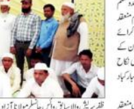
آل انڈیا متحدہ مجاز کے تحت نمائش پنڈال میں ہندو مسلم جوڑوں کی اجتماعی شادی کے دوران اجتماع منعقد کیا گیا۔

آل انڈیا متحدہ مجاز کے تحت نمائش پنڈال میں ہندو مسلم جوڑوں کی اجتماعی شادی کے دوران اجتماع منعقد کیا گیا۔ اس موقع پر ہندو مسلم جوڑوں کی اجتماعی شادی کی تقریب منعقد کی گئی۔