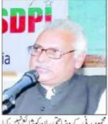
ایس ڈی پی آئی کے سربراہ نے مولانا محمود مدنی کے بیان کو توڑ مروڑ کر پیش کیا جانا قابل مذمت قرار دیا ہے۔

ایس ڈی پی آئی نے مولانا محمود مدنی کے بیان کو توڑ مروڑ کر پیش کیا جانا قابل مذمت قرار دیا ہے۔ ایس ڈی پی آئی نے مولانا محمود مدنی کے بیان کو توڑ مروڑ کر پیش کیا جانا قابل مذمت قرار دیا ہے۔ ایس ڈی پی آئی نے مولانا محمود مدنی کے بیان کو توڑ مروڑ کر پیش کیا جانا قابل مذمت قرار دیا ہے۔