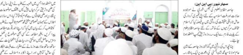
جامعہ مظاہر العلوم میں سہ روزہ تربیتی کیمپ واجلاس عام اختتام پذیر، علماء و دانشوران نے کیا اظہار خیال

سہارنپور (پیس این این) - جامعہ مظاہر العلوم میں سہ روزہ تربیتی کیمپ واجلاس عام اختتام پذیر، علماء و دانشوران نے کیا اظہار خیال جامعہ مظاہر العلوم میں سہ روزہ تربیتی کیمپ واجلاس عام اختتام پذیر، علماء و دانشوران نے کیا اظہار خیال