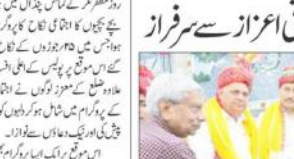
جین مندر انتظامیہ کمیٹی کے زیر اہتمام صحافی اعزاز سے سرفراز کے دوران اجتماع منعقد کیا گیا۔

جین مندر انتظامیہ کمیٹی کے زیر اہتمام صحافی اعزاز سے سرفراز کے دوران اجتماع منعقد کیا گیا۔ اس موقع پر صحافیوں کو اعزاز سے سرفراز کیا گیا۔