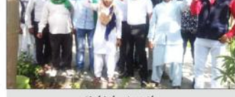
کسانوں کو ووٹ کا صحیح استعمال کرنے پر دلوائی گئی توجہ کے دوران اجتماع منعقد کیا گیا۔

کسانوں کو ووٹ کا صحیح استعمال کرنے پر دلوائی گئی توجہ کے دوران اجتماع منعقد کیا گیا۔ اس اجتماع میں کسانوں کو ووٹ کا صحیح استعمال کرنے پر دلوائی گئی توجہ دی گئی۔