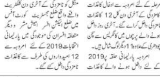
نازروگی کے آخری دن 12 امیدواروں نے داخل کئے کاغذات کے دوران اجتماع منعقد کیا گیا۔

نازروگی کے آخری دن 12 امیدواروں نے داخل کئے کاغذات کے دوران اجتماع منعقد کیا گیا۔ اس اجتماع میں امیدواروں نے اپنے ووٹوں کا اعلان کیا۔