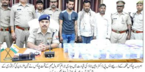
امروہ پور میں پولیس کے سربراہان کی قیادت میں جاری جرائم کنٹرول کمیشن کے تحت پچیس دنوں کے دوران کی گئی کارروائی کے ساتھ پولیس افسران اور پولیس کے افسران کی ایک ٹیم کی تصویر