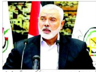
غزہ (ایجنسیاں) اسلامی تحریک کے سربراہ اسماعیل ہانہیہ نے کہا ہے کہ صہیونی ریاست کو ہتھیاروں کی فوجوں کو ہتھیاروں کے بغیر ہتھیاروں سے لڑنا چاہیے۔

امریکی اور صہیونی جارحیت کا مقابلہ کرنے کے لیے پوری قوم کو ہونا ہوگا متحد: اسماعیل ہانہیہ