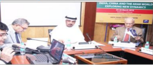
انڈیا عرب تعلیمی اور اقتصادی تعاون کمیٹی کے اجلاس میں شرکت کرنے والے دہلی کے حکام اور اعلیٰ تعلیمی اداروں کے نمائندے۔

ہند-عرب رشتے بہت گہرے اور قدیم انڈیا عرب تعلیمی اور اقتصادی تعاون کمیٹی کے اجلاس میں شرکت کرنے والے دہلی کے حکام اور اعلیٰ تعلیمی اداروں کے نمائندے۔ انڈیا عرب تعلیمی اور اقتصادی تعاون کمیٹی کے اجلاس میں شرکت کرنے والے دہلی کے حکام اور اعلیٰ تعلیمی اداروں کے نمائندے۔ انڈیا عرب تعلیمی اور اقتصادی تعاون کمیٹی کے اجلاس میں شرکت کرنے والے دہلی کے حکام اور اعلیٰ تعلیمی اداروں کے نمائندے۔