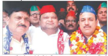
ایس پی وادی سماج وادی پارٹی کے قائدین اور امیدواروں کی قیادت میں بی ایس پی امیدوار کی حمایت میں اجلاس کا انعقاد کیا گیا۔

قراچہ ہندی کے سماجی ملک میں بڑھتے ہوئے فلاح کو فروغ دینے کے لئے ایس پی وادی سماج وادی پارٹی نے ایک اجلاس منعقد کیا۔ اس اجلاس میں ایس پی وادی سماج وادی پارٹی کے قائدین اور امیدواروں کی قیادت میں بی ایس پی امیدوار کی حمایت میں اجلاس کا انعقاد کیا گیا۔