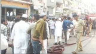
آتشزدگی کے واقعے میں دو بچے جاں بحق ہو گئے۔ پولیس نے آگ لگنے کے وقت موجودہ حالت کا جائزہ لیا ہے۔

دہلی پولیس نے آج صبح آتشزدگی کی تفتیش شروع کی ہے۔ آتشزدگی کے واقعے میں دو بچے جاں بحق ہو گئے۔ پولیس نے آگ لگنے کے وقت موجودہ حالت کا جائزہ لیا ہے۔ آتشزدگی کے واقعے میں دو بچے جاں بحق ہو گئے۔ پولیس نے آگ لگنے کے وقت موجودہ حالت کا جائزہ لیا ہے۔ آتشزدگی کے واقعے میں دو بچے جاں بحق ہو گئے۔ پولیس نے آگ لگنے کے وقت موجودہ حالت کا جائزہ لیا ہے۔