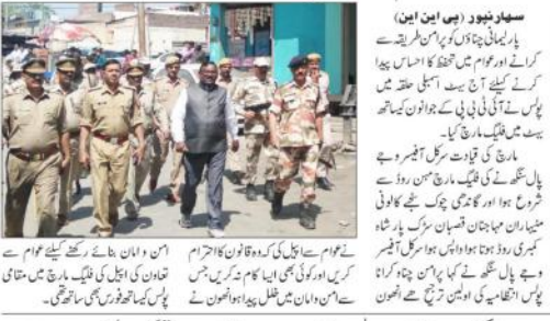
امروہ پور میں پولیس کے سربراہان کی قیادت میں جاری جرائم کنٹرول کمیشن کے تحت پچیس دنوں کے دوران کی گئی کارروائی کے ساتھ پولیس افسران اور پولیس کے افسران کی ایک ٹیم کی تصویر

سہارنپور (پیس این این) - سہارنپور پولیس کے سربراہان کی قیادت میں جاری جرائم کنٹرول کمیشن کے تحت پچیس دنوں کے دوران کی گئی کارروائی کے ساتھ پولیس افسران اور پولیس کے افسران کی ایک ٹیم کی تصویر سہارنپور پولیس کے سربراہان کی قیادت میں جاری جرائم کنٹرول کمیشن کے تحت پچیس دنوں کے دوران کی گئی کارروائی کے ساتھ پولیس افسران اور پولیس کے افسران کی ایک ٹیم کی تصویر