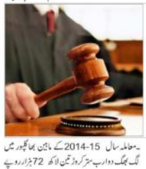
محاطہ سال 2014-15 کے مابین بھارت میں ایک جج اور ایک سرکاری ملازم کے درمیان

گھوٹالے کا ہے۔ الزام کے مطابق، بھارت سازش کے تحت سرکاری مہمہ کا ناکام ہونا اور اس کے نتیجے میں کئی اہلکاروں کی موت ہو گئی۔