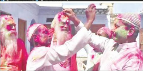
اجودھا میں رام مندر اور پارٹی کے فریقین ہونی چاہتے ہوئے۔