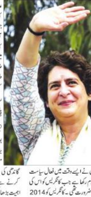
کانگریس کی قومی سیاست میں پرینکا گاندھی کی آمد سے پارٹی کو بڑا فائدہ ہوا ہے۔

نئی دہلی (پری این این بیورو) - کانگریس کی قومی سیاست میں پرینکا گاندھی کی آمد سے پارٹی کو بڑا فائدہ ہوا ہے۔ کانگریس کی قومی سیاست میں پرینکا گاندھی کی آمد سے پارٹی کو بڑا فائدہ ہوا ہے۔ کانگریس کی قومی سیاست میں پرینکا گاندھی کی آمد سے پارٹی کو بڑا فائدہ ہوا ہے۔