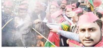
یوگی سرکار کے خلاف احتجاجی کارروائیوں کا سلسلہ جاری ہے۔

نئی دہلی، 13 فروری (سنا کار غازی) اتر پردیش کے سماج وادی جماعت کے اراکین نے یوگی سرکار کے خلاف احتجاجی کارروائیوں کا سلسلہ جاری رکھا ہے۔ ان کے خلاف شہر بھر سے روڑے لگائے گئے اور نیشنل ہائی وے پر بھی احتجاجی کارروائیاں ہو رہی ہیں۔ ان کے خلاف شہر بھر سے روڑے لگائے گئے اور نیشنل ہائی وے پر بھی احتجاجی کارروائیاں ہو رہی ہیں۔ ان کے خلاف شہر بھر سے روڑے لگائے گئے اور نیشنل ہائی وے پر بھی احتجاجی کارروائیاں ہو رہی ہیں۔