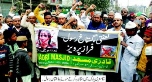
شاہزیادہ یارک میں مظاہر ہوئے اور وہاں عاتق رسول۔

نئی دہلی (ایجنسیاں) ایک طرف ماہر کرائم کے معاملات تیزی سے بڑھ رہے ہیں اور دوسری جانب ایسے ہی معاملات کو حل کرنے کی رفتار سے دہلی پولیس کی سائبر کرائم سیل جیٹی کی رفتار سے کر رہی ہے کام، 465 معاملات ہوئے درج، 22 فیصد کا نکال۔