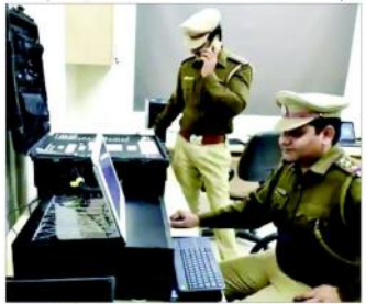
102 معاملات کی ہی تفتیش مکمل کر پائی، جن میں سے ساہیبر کرائم سیل صرف

دہلی پولیس کی سائبر کرائم سیل جیٹی کی رفتار سے کر رہی ہے کام، 465 معاملات ہوئے درج، 22 فیصد کا نکال۔ پولیس کی سائبر کرائم سیل جیٹی کی رفتار سے کر رہی ہے کام، 465 معاملات ہوئے درج، 22 فیصد کا نکال۔ پولیس کی سائبر کرائم سیل جیٹی کی رفتار سے کر رہی ہے کام، 465 معاملات ہوئے درج، 22 فیصد کا نکال۔