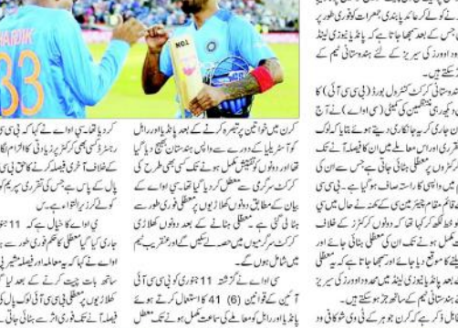
ہندوستانی آل راؤنڈر ہارڈک پانڈیا اور لوکیش راہل کی معظلی ختم ہو گئی ہے۔ انہوں نے ٹیم میں شامل ہونے کی بات کہی ہے۔ انہوں نے ٹیم میں شامل ہونے کی بات کہی ہے۔ انہوں نے ٹیم میں شامل ہونے کی بات کہی ہے۔