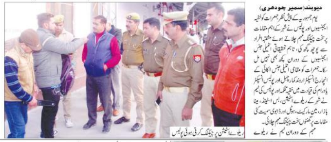
ریلوے اسٹیشن پر چیکنگ کرتی ہوئی پولیس

اہم مقامات، ہوٹلوں، بس اسٹینڈز اور ریلوے اسٹیشنوں پر خفیہ محکمہ اور پولیس نے چلائی چیکنگ مہم