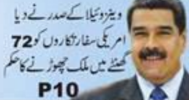
ہیرو نیٹا کے صدر نے دیا امریکی سفارتکاروں کو 72 گھنٹے میں ملک چھوڑنے کا حکم P10