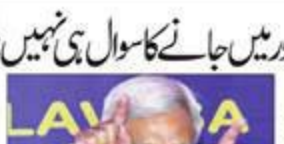
بیلٹ کے دور میں جانے کا سوال ہی نہیں: ایکشن کمشنر

نئی دہلی: ڈوڑی کے بیٹے باپ کا نام کریشن ہے۔ اس کے بارے میں خبریں گردش کر رہی ہیں۔ ڈوڑی کے بیٹے باپ کا نام کریشن ہے۔ اس کے بارے میں خبریں گردش کر رہی ہیں۔