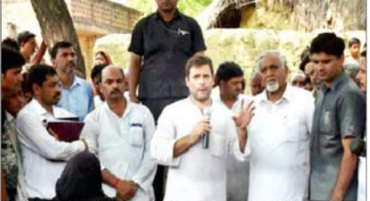
راہل گاندھی نے کہا کہ جیسے ہندو متیوں سے دشمنی نہیں ہے، ویسا ہی بی ایس پی اور کانگریس کے مقصد ایک ہمارے فکریں یکسانیت ہے۔