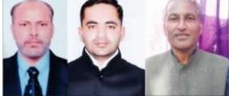
کیزن لوگ سہا جیت سے امیدواروں کے بارے میں اہم شخصیات کا اظہار خیال