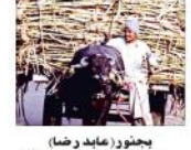
بھنڈو (ماید وضام)