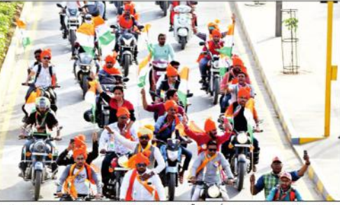
آج کل کے ہندو متیوں کے پیروں میں سچ کی آواز کی آگے بڑھنے کی ایک اور علامت ہے۔