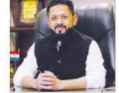
دیوبند (سمیر جودھری)