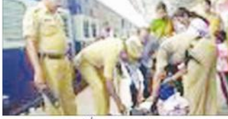
پیم جمہوریہ کے پیش نظر ریلوے کے مسافروں کے سہولت پیکٹ