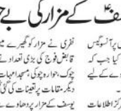
تائبلس (جینسیاں) یہودیوں نے حضرت یوسفؑ کے مزار کی بے حرمتی کی۔

یہودیوں نے حضرت یوسفؑ کے مزار کی بے حرمتی کی۔ یہودیوں نے حضرت یوسفؑ کے مزار کی بے حرمتی کی۔ یہودیوں نے حضرت یوسفؑ کے مزار کی بے حرمتی کی۔