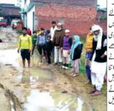
مسلمانوں کی بستی رسول پور گنگر کی لا پرواہی کا شکار ہے۔

25 سال سے آباد بستی کی خستہ حالی نہیں ہوتی ختم مسلمانوں کی بستی رسول پور گنگر کی لا پرواہی کا شکار ہے۔ اس علاقے میں لوگوں کی زندگی بے حد مشکل ہے۔