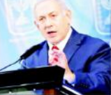
یروشلم (جینسیاں) اسرائیل کے وزیر اعظم بینجمن نتان

رات بھر شام میں اسرائیلی ہوائی اڈوں کو نشانہ بنایا۔ ایران کے اسرائیل کو نشانہ کرنے کا ہدف رکھنے کی طرف اشارہ کرتے ہوئے نتان نے کہا کہ اسرائیل شام میں مزید کارروائی کرے گا۔ اسرائیلی ہوائی اڈوں کو نشانہ کرنے کی ہدف چاہتے ہیں۔ نتان نے کہا کہ اسرائیل شام میں مزید کارروائی کرے گا۔ اسرائیلی ہوائی اڈوں کو نشانہ کرنے کی ہدف چاہتے ہیں۔ نتان نے کہا کہ اسرائیل شام میں مزید کارروائی کرے گا۔ اسرائیلی ہوائی اڈوں کو نشانہ کرنے کی ہدف چاہتے ہیں۔