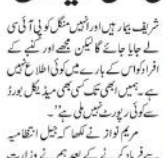
لاہور (ایو این آئی) نواز شریف کو اسپتال میں زیر علاج رکھا گیا۔

نواز شریف کی طبیعت ناساز رہی۔ نواز شریف کی طبیعت ناساز رہی۔ نواز شریف کی طبیعت ناساز رہی۔ نواز شریف کی طبیعت ناساز رہی۔