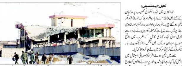
طالبان کا ایک حملہ افغانستان میں فوجی تربیتی مرکز پر ایک گاڑی سے بارود کا حملہ کیا گیا۔

افغانستان میں ایک سیکورٹی ٹیم کی قیادت میں طالبان کے حملے میں 126 افراد ہلاک ہوئے۔ فوجی تربیتی مرکز پر ایک گاڑی سے بارود کا حملہ کیا گیا۔ طالبان کے حملے میں 126 افراد ہلاک ہوئے۔ فوجی تربیتی مرکز پر ایک گاڑی سے بارود کا حملہ کیا گیا۔ طالبان کے حملے میں 126 افراد ہلاک ہوئے۔ فوجی تربیتی مرکز پر ایک گاڑی سے بارود کا حملہ کیا گیا۔