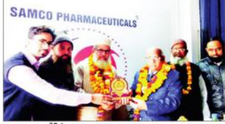
معروف کینسر معالج ڈاکٹر آر کے گپتا کو استقبالیہ

معروف کینسر معالج ڈاکٹر آر کے گپتا کو استقبالیہ ڈاکٹر آر کے گپتا کو استقبالیہ