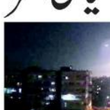
بغداد (جینسیاں) عراق میں ایران نواز ملیشیا کی اسرائیل کو دھمکی دی۔

عراق میں ایران نواز ملیشیا کی اسرائیل کو دھمکی دی۔ عراق میں ایران نواز ملیشیا کی اسرائیل کو دھمکی دی۔ عراق میں ایران نواز ملیشیا کی اسرائیل کو دھمکی دی۔