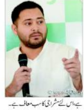
بھگوسرائی (بیو این آئی) بھار میں پولیس کے ایک علاقے کے ایک شخص کی تصویر۔

بانی بھارت- بھارتیہ جگڑہ سے ہیں۔ 19۶۸ء میں بھارت میں پیدا ہوئے۔