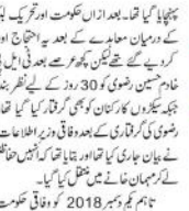
لاہور (جینسیاں) اندرونِ پاکستان کی ایک خصوصی عدالت نے رضوی کو جیل بھیج دیا۔

افغانستان میں رضوی کو جیل بھیج دیا گیا۔ رضوی کو جیل بھیج دیا گیا۔ رضوی کو جیل بھیج دیا گیا۔ رضوی کو جیل بھیج دیا گیا۔