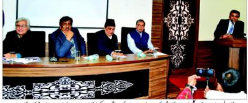
دہلی پبلیسن آف جرنلسٹ اور انڈیا اسلامک کچلر اینسٹیٹیوٹ کے اشتراک سے اردو صحافت کو روپوش مسائل پر سیمینار کا انعقاد

دہلی پبلیسن آف جرنلسٹ (ڈی پبلیسن) اور انڈیا اسلامک کچلر اینسٹیٹیوٹ کے اشتراک سے اردو صحافت کو روپوش مسائل پر سیمینار کا انعقاد