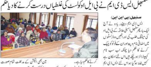
ایس ڈی ایم نے بی بی ایل او کو لسٹ کی غلطیاں درست کرنے کا کام جاری رکھا ہے۔

سنجیدگی ایس ڈی ایم نے بی بی ایل او کو لسٹ کی غلطیاں درست کرنے کا کام جاری رکھا ہے۔ ایس ڈی ایم نے ایک فہرست میں اضافی نام تلاش کرنے کے کام پر توجہ دی ہے۔