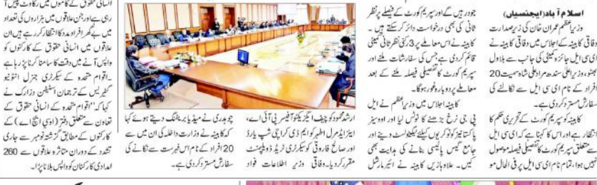
بلاول، مراد علی شاہ سمیت 20 نام ECL سے نکالنے کی سفارش مسترد: وفاقی کابینہ