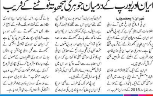
ایران اور یورپ کے درمیان جوہری تجھوت ٹوٹنے کے قریب ہے۔

تہران (بیجنسیاں) ایران اور یورپ کے درمیان جوہری تجھوت ٹوٹنے کے قریب ہے۔ ایران اور یورپ کے درمیان جوہری تجھوت ٹوٹنے کے قریب ہے۔