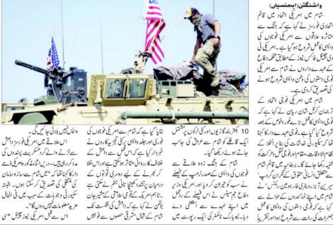
امریکی فوجیوں نے شام کے مختلف علاقوں سے واپسی شروع کی ہے۔ فوجیوں کی واپسی کے ساتھ ساتھ امریکی فوجیوں کی نقل و حرکت کو خفیہ رکھا جائے گا۔

واشنگٹن (بیجنسیاں) شام میں امریکی افوج کی واپسی شروع ہو گئی ہے۔ امریکی فوجیوں نے شام کے مختلف علاقوں سے واپسی شروع کی ہے۔ فوجیوں کی واپسی کے ساتھ ساتھ امریکی فوجیوں کی نقل و حرکت کو خفیہ رکھا جائے گا۔ امریکی فوجیوں نے شام کے مختلف علاقوں سے واپسی شروع کی ہے۔ فوجیوں کی واپسی کے ساتھ ساتھ امریکی فوجیوں کی نقل و حرکت کو خفیہ رکھا جائے گا۔