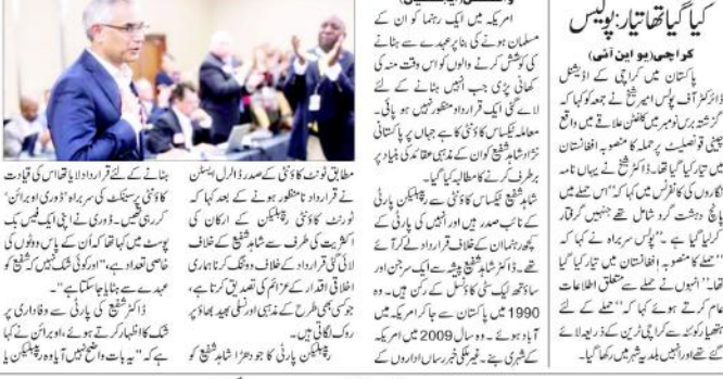
امریکی سینیٹ نے ایک قرارداد منظور کی ہے جس کے تحت مسلمان ہونے کے باعث عہدے سے ہٹانے کی قرارداد منظور کی جائے گی۔

واشنگٹن (بیجنسیاں) امریکی سینیٹ نے ایک قرارداد منظور کی ہے جس کے تحت مسلمان ہونے کے باعث عہدے سے ہٹانے کی قرارداد منظور کی جائے گی۔ امریکی سینیٹ نے ایک قرارداد منظور کی ہے جس کے تحت مسلمان ہونے کے باعث عہدے سے ہٹانے کی قرارداد منظور کی جائے گی۔