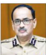
مفتی صاحب (پس امین امین) کی طرف سے اگلی سماعت کے لیے طلبہ کی فہرست جاری کی گئی ہے۔

انہوں نے کہا تھا کہ آدک ورما کو بائیکاٹ کرنے کے لیے سی بی آئی نے کامیابی حاصل کرنا ہے اور اس کے لیے وہ ہٹائے گئے۔ سی بی آئی نے اس کے لیے ایک پلان تیار کیا تھا اور اس میں سی بی آئی کے افسران کی مدد سے ان کی شناخت کی گئی اور ان کی شناخت کی گئی اور ان کی شناخت کی گئی۔