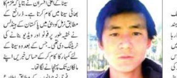
چین سے ہندوستان کی سرحد پر پیکڑا گیا جاسوس

چین سے ہندوستان کی سرحد پر ایک جاسوس پیکڑا گیا۔ ان کی حکومت نے ان کی سرکاری گاڑی کو ایک ایف ڈی کے نوٹس کے تحت ضبط کیا ہے۔ ان کی حکومت نے ان کی سرکاری گاڑی کو ایک ایف ڈی کے نوٹس کے تحت ضبط کیا ہے۔ ان کی حکومت نے ان کی سرکاری گاڑی کو ایک ایف ڈی کے نوٹس کے تحت ضبط کیا ہے۔