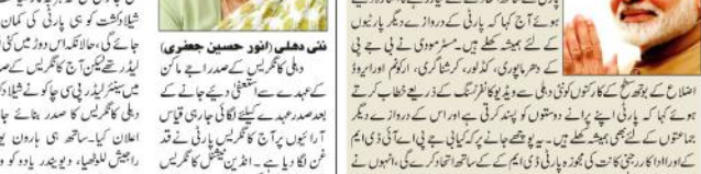
نarendra Modi کے اشارے

مودی نے دیئے گئے بندھن کے اشارے دیئے۔ ان کی حکومت نے ان کی سرکاری گاڑی کو ایک ایف ڈی کے نوٹس کے تحت ضبط کیا ہے۔ ان کی حکومت نے ان کی سرکاری گاڑی کو ایک ایف ڈی کے نوٹس کے تحت ضبط کیا ہے۔ ان کی حکومت نے ان کی سرکاری گاڑی کو ایک ایف ڈی کے نوٹس کے تحت ضبط کیا ہے۔