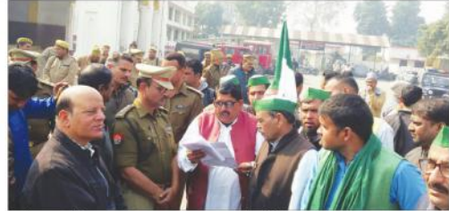
رام پور (مگھیا علی) میں کسانوں کے ساتھ ہونے والے احتجاجی مظاہرے کے دوران۔

کروڑوں کے پاس کرنا چاہیے۔ رام پورنگ تھیل ہائی وے پر کسانوں کی ٹی ٹی ٹی گاڑیوں کا ہجوم دیکھا جاتا ہے۔ کسانوں کی زمین کا معائنہ سے قیمت ادا کی جائے تاخیر نہیں ہونے کے لیے۔ پیرا مشن ڈیپارٹمنٹ میں ایس ای ایم آفس کے افسران کی زمین کا معائنہ سے قیمت ادا کی جائے تاخیر نہیں ہونے کے لیے۔ پیرا مشن ڈیپارٹمنٹ میں ایس ای ایم آفس کے افسران کی زمین کا معائنہ سے قیمت ادا کی جائے تاخیر نہیں ہونے کے لیے۔