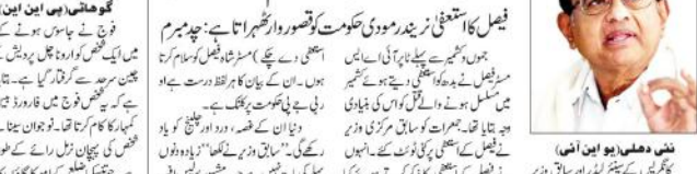
شاہ فیصل کو سلام کرنے والے شخص

میں شاہ فیصل کو سلام کرتا ہوں۔ ان کی حکومت نے ان کی سرکاری گاڑی کو ایک ایف ڈی کے نوٹس کے تحت ضبط کیا ہے۔ ان کی حکومت نے ان کی سرکاری گاڑی کو ایک ایف ڈی کے نوٹس کے تحت ضبط کیا ہے۔ ان کی حکومت نے ان کی سرکاری گاڑی کو ایک ایف ڈی کے نوٹس کے تحت ضبط کیا ہے۔