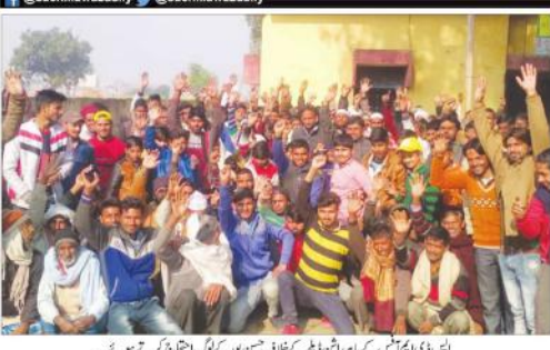
ایس ای ایم آفس کے پیرا مشن ڈیپارٹمنٹ کے خلاف سمن پر کڑے احتجاج کرتے ہوئے۔