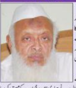
مفتی صاحب (پس امین امین) کی طرف سے اگلی سماعت کے لیے طلبہ کی فہرست جاری کی گئی ہے۔

بابری معاملے کی سنوائی میں نیا بیج نہج مٹے، بنے گی نئی بیج، اگلی سماعت 29 کو۔ مفتی صاحب کی طرف سے اگلی سماعت کے لیے طلبہ کی فہرست جاری کی گئی ہے۔