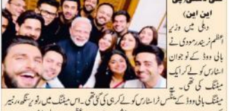
نئی دہلی میں پی ایم کے ساتھ بالی ووڈ ستاروں کی میٹنگ

پی ایم نے بالی ووڈ کے مشہور ستاروں سے میٹنگ کی۔ ان کی حکومت نے ان کی سرکاری گاڑی کو ایک ایف ڈی کے نوٹس کے تحت ضبط کیا ہے۔ ان کی حکومت نے ان کی سرکاری گاڑی کو ایک ایف ڈی کے نوٹس کے تحت ضبط کیا ہے۔ ان کی حکومت نے ان کی سرکاری گاڑی کو ایک ایف ڈی کے نوٹس کے تحت ضبط کیا ہے۔