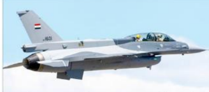
عراقی فضائیہ کے ایک ایف 16 جیٹ طیارے نے شام کے وسطی علاقوں میں داعش کے ٹھکانے پر بمباری کی۔

شام کے وسطی علاقوں میں داعش کے ٹھکانے پر عراق کی بمباری کی گئی۔ شامی حکومت نے عراق کی بمباری کی اجازت دی۔ عراقی فوجوں نے شام کے وسطی علاقوں میں داعش کے ٹھکانے پر بمباری کی۔ شامی حکومت نے عراق کی بمباری کی اجازت دی۔ عراقی فوجوں نے شام کے وسطی علاقوں میں داعش کے ٹھکانے پر بمباری کی۔ شامی حکومت نے عراق کی بمباری کی اجازت دی۔ عراقی فوجوں نے شام کے وسطی علاقوں میں داعش کے ٹھکانے پر بمباری کی۔