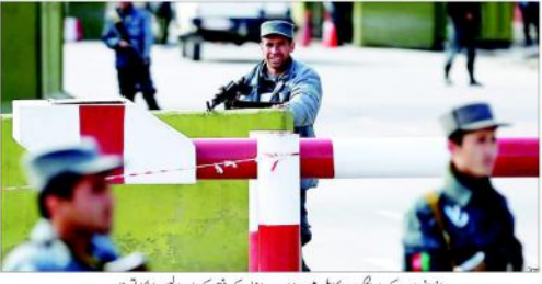
افغانستان کے دارالحکومت کابل میں وزارت داخلہ کے دفتر کے باہر پولیس اہلکاروں کی پوزیشن