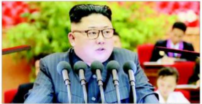
بیانگ بیانگ (ایجنسیاں) اپنے خطاب میں کم جونگ نے امریکی صدر ٹرمپ کو یہ بھی یاد دلایا کہ اگر وہ اپنی نئی سال کی تقریر میں کم جونگ کے بارے میں کوئی بھی بات کہے گا تو امریکا اسے شدید دھمکی دے گا۔

جوہری ہتھیاروں پر امریکی صدر کے ساتھ مذاکرات 2019ء میں بھی رہیں گے جاری