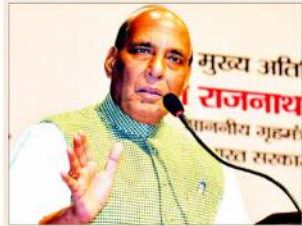
راجنا تھ سنگھ اتر پردیش کے وزیر اعلیٰ اور مرکزی وزیر داخلہ اور ایوانوں کے امور۔

یوپی کی آبادی کو بوجھ نہیں سمجھنا چاہئے، اس کا صحیح استعمال کرنا چاہئے: راجنا تھ سنگھ