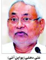
ڈاکٹر مہدی یوساینی (آئی) لوک سبھا اقلیت سے رام مندر کی سرپرستی کے لیے ایک نئی سرکار بنانے کے لیے کام کر رہے ہیں۔

بمطابق عدالت کے فیصلے سے حل ہوگا۔ رام مندر کا مسئلہ تیش کے لیے ایک نئی سرکار بنانے کے لیے کام کر رہے ہیں۔ رام مندر کی سرپرستی کے لیے ایک نئی سرکار بنانے کے لیے کام کر رہے ہیں۔ رام مندر کی سرپرستی کے لیے ایک نئی سرکار بنانے کے لیے کام کر رہے ہیں۔