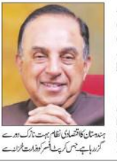
سبر انیم سوامی

نئی دہلی: ہندوستان کے دہانے پر نازک دور سے گزر رہا ہے ملک، وزارت خزانہ کا ہر قدم فیمل، وزیر یونینک کا گورنر بد عنوانی میں ملوث: سبر انیم سوامی