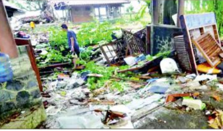
اندونیشیا میں تباہ کن سونامی کے مناظر، جس میں 168 افراد ہلاک 745 زخمی ہوئے۔