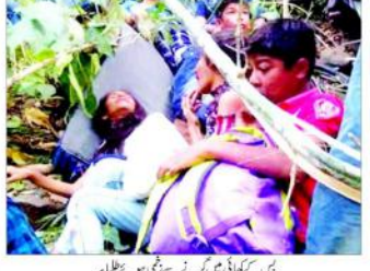
فانگہ (یو این آئی) گجرات میں اسکولی بس کھائی میں گر گئی، 12 بچوں کی موت۔

گجرات میں اسکولی بس کھائی میں گر گئی، 12 بچوں کی موت۔