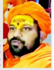
اجو دیھیا (یو این آئی) راجستھان کے ایک اقلیت سے تعلق رکھنے والے ایک شخص۔

سیاسی لیڈروں کے بیانات ہومان جی کا اپمان، مقدمہ کرنے کا مہنت کا اعلان