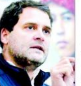
کلسکتہ (یو این آئی) پہلے ہی رام مندر کی سرپرستی کے لیے ایک نئی سرکار بنانے کے لیے کام کر رہے ہیں۔

عام آدمی پارٹی کی دہلی سے منسلک مظفر نگر وغیرہ میں گرفت مضبوط ہو رہی ہے۔ چنانچہ وہ ہرت پردیش بنانے کا مطالبہ لیکر یوپی کے میدان میں کود پڑی ہے۔