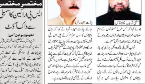
مذہبی رہنماؤں نے کیا سخت اعتراض...