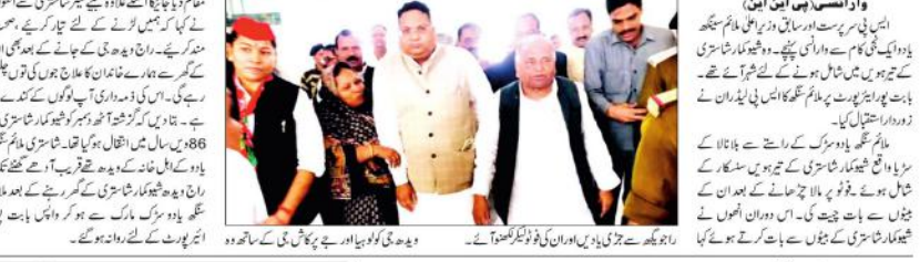
راجیو کے جڑی بڑی دیں اور ان کو ڈونڈ کرنا... دیو جی کو بھانپا اور بے پروا کی گئی کے ساتھ وہ...