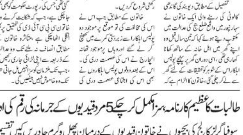
سہارنپور (سید حسام)...