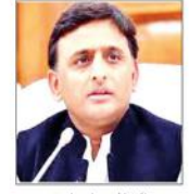
لکھنؤ میں امین ایچ اے پی (انس پی) سربراہ

سابق وزیر اعلیٰ کھلیش نے دے ریاست میں لکھنؤ میں ہونے والے اجلاس کے دوران کہا کہ ریاست میں جرائم پیشہ افراد کو حکومت نے پشت پناہی کی ہے۔ ان کا کہنا ہے کہ ریاست میں جرائم پیشہ افراد کو حکومت نے پشت پناہی کی ہے۔ ان کا کہنا ہے کہ ریاست میں جرائم پیشہ افراد کو حکومت نے پشت پناہی کی ہے۔