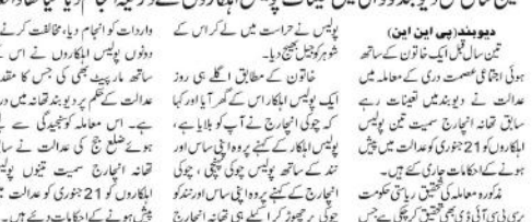
دہلیوی این ایس... ملازم اسپیکٹر پولیس اہلکاروں کو 21 جنوری تک عدالت میں پیش ہونے کا حکم...