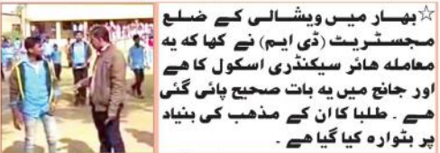
اسکول میں ہندو اور مسلم بچوں کا بٹوارہ ڈسٹرکٹ ایجوکیشن آفسر کا پرنسپل پر کارروائی کا حکم

بھارت میں ویٹھالی کے مذہب اور ڈاکٹ کے نام پر طلبہ میں امتیاز کرنے کے سلسلے میں معاملہ منظر عام پر آیا ہے۔