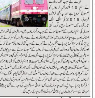
دہلیوی این ایس... کمرے کے سبب دس اہم ٹرینیں منسوخ...