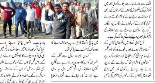
دہلیوی این ایس جھوڑی... ایس ڈی ایم کے سامنے رکھے مسائل...