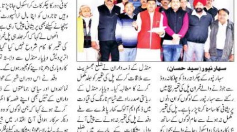
سہارنپور (سید حسام)...