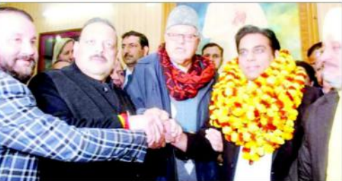
جسوں، ڈاکٹر مہنگی بھگت کی پیشکش کاؤٹرز میں عزت کے موقع کی ایک تصویر۔