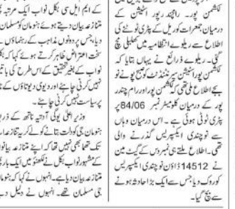
دہلیوی این ایس... ریل کی ٹوٹی ہوئی پٹری کی اطلاع سے افراتفری...