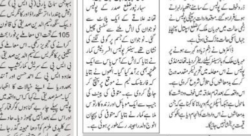
دہلیوی این ایس... خالی پڑے پلاٹ سے نوجوان کی لاش برآمد...