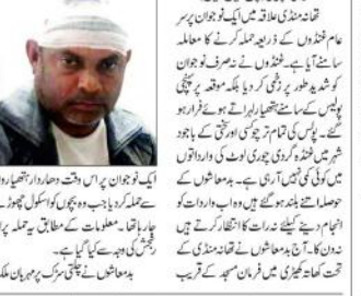
دہلیوی این ایس... بچوں کو اسکول چھوڑنے جارہے نوجوان پر حملہ...