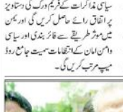
نیپال کے پہلے وزیر اعظم تسلیم گری کا انتقال