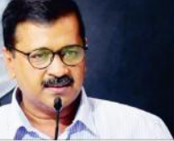
نئی دہلی (انور حسین جعفری) ہریانہ کے سابق وزیر اعلیٰ اروند کجریوال نے 1984 کے سکھ مخالف فسادات میں شامل لوگوں کو بھی سزا دی جائے گی کی بات کہی ہے۔

نئی دہلی (انور حسین جعفری) ہریانہ کے سابق وزیر اعلیٰ اروند کجریوال نے 1984 کے سکھ مخالف فسادات میں شامل لوگوں کو بھی سزا دی جائے گی کی بات کہی ہے۔ انہوں نے کہا کہ 1984 کے سکھ مخالف فسادات میں شامل لوگوں کو بھی سزا دی جائے گی کی بات کہی ہے۔ انہوں نے کہا کہ 1984 کے سکھ مخالف فسادات میں شامل لوگوں کو بھی سزا دی جائے گی کی بات کہی ہے۔