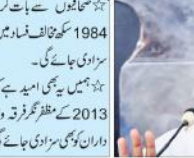
نئی دہلی (انور حسین جعفری) ہریانہ کے سابق وزیر اعلیٰ اروند کجریوال نے 1984 کے سکھ مخالف فسادات میں شامل لوگوں کو بھی سزا دی جائے گی کی بات کہی ہے۔