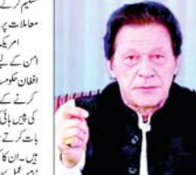
وزیراعظم محمد شریف

افغانستان میں امن کیلئے ہر ممکن مدد کی جائے گی: وزیراعظم۔ افغانستان میں امن کیلئے ہر ممکن مدد کی جائے گی: وزیراعظم۔ افغانستان میں امن کیلئے ہر ممکن مدد کی جائے گی: وزیراعظم۔