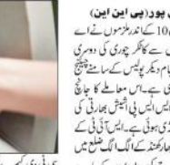
بھاگل پور (بی این این) ایک ٹی ایم چوروں کے سرغنہ کو پکڑنے میں پولیس ناکام رہی۔

بھاگل پور (بی این این) ایک ٹی ایم چوروں کے سرغنہ کو پکڑنے میں پولیس ناکام رہی۔ پولیس اے ٹی ایم چوروں کے سرغنہ کو پکڑنے میں پولیس ناکام رہی۔