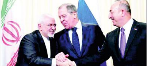
وزیر خارجہ مولود پوٹین، وزیر خارجہ محمد شیخ رشید، وزیر خارجہ محمد شیخ رشید اور وزیر خارجہ محمد شیخ رشید کے ساتھ ایک میٹنگ کے دوران۔

جینوا (ایجنسیاں) روس، ایران اور ترکی شام کے لیے آئینی ساز کمیٹی تشکیل دینے کی پوری کوشش کر رہے ہیں تاکہ انتخابات سے قبل نئے آئینی کی بنیادی راہ ہموار ہو سکے۔ شام کا انکشاف، مقامی ذرائع نے کہا ہے کہ ذرائع کے مطابق نئے حکومتوں کے درمیان مذاکرات میں اکتھام ہو رہی ہیں۔ جینوا وہ اپنی مشترکہ تجویز کے لیے اقوام متحدہ کی مداخلت کے خواہش مند ہے۔ شام کے لیے اقوام متحدہ کے خصوصی اے جی اے اسٹیشن ڈی مسیورہ وہاں سالانہ اسٹاف میٹنگ کے لیے آئے ہیں۔ اسٹاف میٹنگ کے لیے آئے ہیں۔ اسٹاف میٹنگ اور اسٹاف میٹنگ دونوں اپنے اپنے 50 ممبروں کی فہرستیں لائیں۔ اسٹاف میٹنگ کے لیے آئے ہیں۔ اسٹاف میٹنگ اور اسٹاف میٹنگ دونوں اپنے اپنے 50 ممبروں کی فہرستیں لائیں۔ اسٹاف میٹنگ کے لیے آئے ہیں۔ اسٹاف میٹنگ اور اسٹاف میٹنگ دونوں اپنے اپنے 50 ممبروں کی فہرستیں لائیں۔