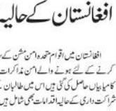
نیوا یارک (یو این این)

افغانستان میں اقوام متحدہ امن مشن کے سربراہ ڈیوئیڈ ہارڈن نے کہا ہے کہ افغانستان میں شروع ہونے والے امن مذاکرات حقیقت پر مبنی اور اقوام متحدہ کے مفادات کے مطابق ہیں۔