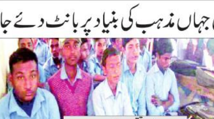
پٹنہ (بی این این) ایک سرکاری اسکول جہاں مذہب کی بنیاد پر بانٹ دئے جاتے ہیں طلباء۔

پٹنہ (بی این این) ایک سرکاری اسکول جہاں مذہب کی بنیاد پر بانٹ دئے جاتے ہیں طلباء۔ اس اسکول میں طلباء کو مذہب کی بنیاد پر بانٹ دئے جاتے ہیں۔