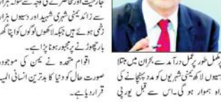
سعودی عرب کو جرمن ہتھیاروں کی سپلائی بند

پاریس نے جرمنی کے خلاف ہتھیاروں کی سپلائی بند کرنے کا فیصلہ کیا ہے۔