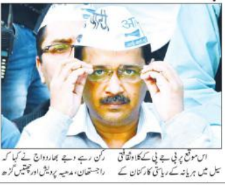
منشی دہلی (پی این این) کے کئی لیڈران نے وزیر اعلیٰ اروند کجریوال سے ملاقات کے بعد اختیاری آپ کی رکنیت حاصل کرنے کے لیے بی جے پی کے لیڈران سے ملاقات کی۔ ان کے ساتھ بی جے پی کے دیگر لیڈران بھی تھے۔ ان کے ساتھ بی جے پی کے دیگر لیڈران بھی تھے۔

منشی دہلی (پی این این) کے کئی لیڈران نے وزیر اعلیٰ اروند کجریوال سے ملاقات کے بعد اختیاری آپ کی رکنیت حاصل کرنے کے لیے بی جے پی کے لیڈران سے ملاقات کی۔ ان کے ساتھ بی جے پی کے دیگر لیڈران بھی تھے۔ ان کے ساتھ بی جے پی کے دیگر لیڈران بھی تھے۔ ان کے ساتھ بی جے پی کے دیگر لیڈران بھی تھے۔