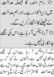
رام مندر اور ہومان کو انتخابی ایجنڈا نہ بنانے کا مشورہ دیا گیا ہے۔

پنشن (بی بی این) رام مندر اور ہومان کو انتخابی ایجنڈا نہ بنانے کا مشورہ دیا گیا ہے۔