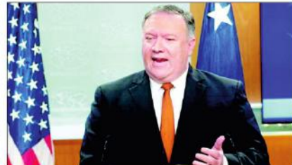
امریکی وزیر خارجہ میک پومینو نے ایک پریس کانفرنس میں کہا ہے کہ سعودی عرب امریکی سیکورٹی کے لیے ایک اہم اتحادی ملک ہے۔ ان کے ساتھ ساتھ اسرائیل اور امریکہ کی سیکورٹی کے لیے ایک اہم اتحادی ملک ہے۔

تیسرا دن کے اپنے معاہدے کو چھبے بجے ہی باقی رکھے۔ البتہ دوسری جانب امریکی کانگریس کو کوشش کر رہے ہیں کہ ایک قرارداد پاس کر کے سعودی ولیعہد کو قاتل ٹھہرا کر دیا جائے۔ ریاض میں امریکی وزیر خارجہ میک پومینو نے ایک پریس کانفرنس میں کہا ہے کہ سعودی عرب امریکی سیکورٹی کے لیے ایک اہم اتحادی ملک ہے۔ ان کے ساتھ ساتھ اسرائیل اور امریکہ کی سیکورٹی کے لیے ایک اہم اتحادی ملک ہے۔ ان کے ساتھ ساتھ اسرائیل اور امریکہ کی سیکورٹی کے لیے ایک اہم اتحادی ملک ہے۔