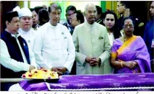
یگان محمد مہر پر رام پور کوئی خوراک اور تیار ہونے والے ہونے کے سلسلے میں شریک ہوئے۔