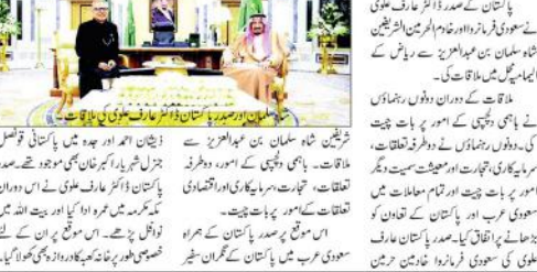
پاکستان کے صدر ذاکر خان نے سعودی فرمانروا سلمان بن عبدالعزیز سے ملاقات کی۔

دو طرفہ تعلقات، سرمایہ کاری، تجارت اور معیشت سمیت دیگر امور پر اتفاق