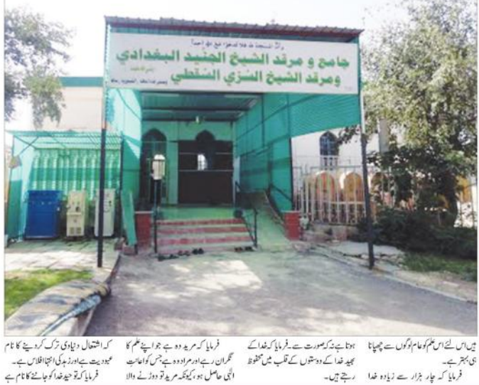
فرمایا کہ اللہ تعالیٰ نے ان کو ایسا سیکھ کر دیا ہے جس سے ان کے دل میں اللہ تعالیٰ کی وحدانیت کی بات آتی ہے۔

فرمایا کہ روز ازال اللہ تعالیٰ نے اہلسنت پر سونپ کر فرما کر اور ان کو ایسا سیکھ کر دیا ہے جس سے ان کے دل میں اللہ تعالیٰ کی وحدانیت کی بات آتی ہے۔ فرمایا کہ اللہ تعالیٰ نے ان کو ایسا سیکھ کر دیا ہے جس سے ان کے دل میں اللہ تعالیٰ کی وحدانیت کی بات آتی ہے۔ فرمایا کہ اللہ تعالیٰ نے ان کو ایسا سیکھ کر دیا ہے جس سے ان کے دل میں اللہ تعالیٰ کی وحدانیت کی بات آتی ہے۔