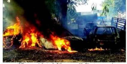
ملزموں میں سے دو ملزموں نے فرار کر لیا ہے۔ ایک گرفتار ملزم کو دیکھ کر پولس نے چنگر اٹھی۔

بلندشہر (بی این این) اتر پردیش کے بلڈیش میں جالی میں بھڑکے تھوڑے کے معاملہ میں فرار پل رہے مہاب، نیابانس اور دیگر ملزموں کے خلاف وارنٹ جاری کی گئی ہے۔ پولس نے چنگر اٹھی، مہاب، نیابانس سمیت کئی گاؤں میں کی چھاپہ ماری۔