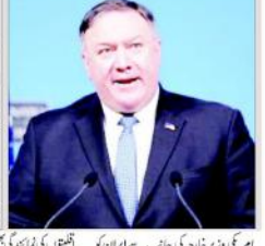
امریکی وزیر خارجہ نے اس بیان میں روس اور ازبکستان کو ان ممالک کی خاص فہرست میں قرار دیا ہے کہ جو یا تو مذہبی یا پھر مذہبی آزادی کے منافی کام کر رہے ہیں۔

فہرست میں ایران، چین، سعودی عرب، میانمار، اریٹریا، شامی کوریا، سوڈان، تاجکستان اور ترکمانستان شامل