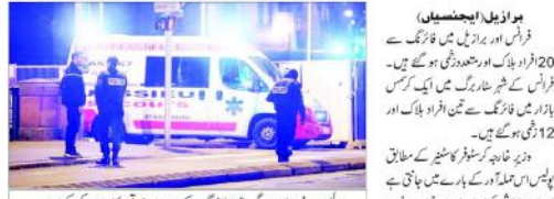
فرانس اور برازیل میں فائرنگ کے بعد 20 افراد ہلاک اور متعدد زخمی ہو گئے ہیں۔

فرانس اور برازیل میں فائرنگ کے بعد 20 افراد ہلاک اور متعدد زخمی ہو گئے ہیں۔ فرانس اور برازیل میں فائرنگ کے بعد 20 افراد ہلاک اور متعدد زخمی ہو گئے ہیں۔