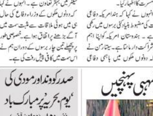
نشی دھلی (بی ایس این)۔ مرکزی وزیر ابوبھارتی کی فیصلہ ہے۔

ایس آئی ٹی کی تشکیل کے لئے ایس آئی ٹی کے 186 بند مودوں کی تشکیل کا حکم دیا گیا ہے۔