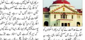
ایک بچی اسکول نہ آتی تھی۔ اس کی والدین نے اسے اسکول سے ہٹا دیا۔ کورٹ نے اس کی والدین کو سزا دی۔ کورٹ نے کہا کہ اسکول کے ٹیچر اس کی تعلیم دینے کے لئے تیار ہیں۔

ایک بچی اسکول نہ آتی تھی۔ اس کی والدین نے اسے اسکول سے ہٹا دیا۔ کورٹ نے اس کی والدین کو سزا دی۔ کورٹ نے کہا کہ اسکول کے ٹیچر اس کی تعلیم دینے کے لئے تیار ہیں۔ والدین نے اسے اسکول سے ہٹا دیا۔ کورٹ نے اس کی والدین کو سزا دی۔