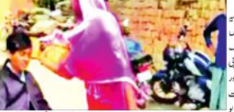
مظفر پور ضلع میں شوہر نے بیوی کو طلاق دیا۔ بیوی نے طمانچہ لگایا۔ شوہر نے کہا کہ بیوی نے طلاق دینے کے بعد وہ بہت دکھ میں ہے۔

مظفر پور ضلع میں شوہر نے بیوی کو طلاق دیا۔ بیوی نے طمانچہ لگایا۔ شوہر نے کہا کہ بیوی نے طلاق دینے کے بعد وہ بہت دکھ میں ہے۔ بیوی نے کہا کہ شوہر نے طلاق دینے کے بعد وہ بہت دکھ میں ہے۔ بیوی نے کہا کہ شوہر نے طلاق دینے کے بعد وہ بہت دکھ میں ہے۔