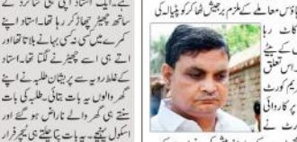
مظفر پور شیشہ ہاؤس معاملہ، برہمچش ٹھاکر کو فوری علاج کرانے کا حکم دیا گیا۔ عدالت نے ٹھاکر کو فوری علاج کرانے کا حکم دیا۔