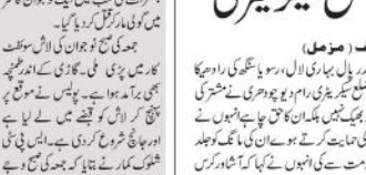
آشاور کرس کو بھیک نہیں انکا حق چاہئے: ضلع سیکریٹری نے کہا کہ آشاور کرس کو بھیک نہیں دینی چاہئے۔ ان کا حق ہے کہ وہ اپنی زندگی بسر کریں۔