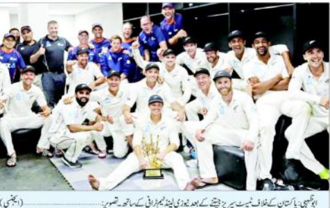
ابو ظہبی پاکستان کے خلاف سیریز جیتنے کے بعد ٹیم کی تقریبی تصویر۔ (پنشنہ)