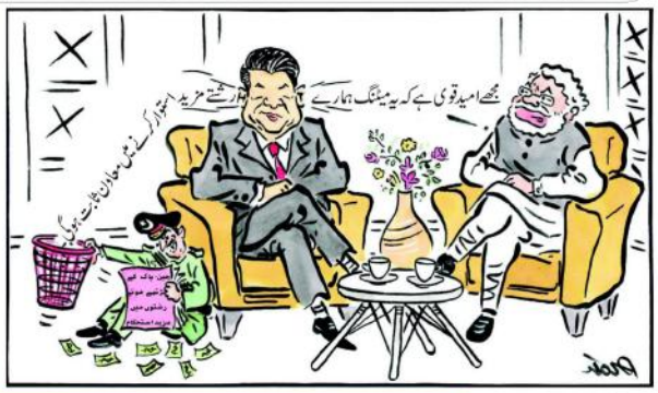
مجھے امید تھی کہ بی بی نے سٹیٹنگ ہمارے لئے...