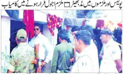
پولیس نے ایک دھماکہ خیز مواد کے ساتھ ملزموں کو گرفتار کیا۔ ملزموں میں سے ایک نے فرار ہونے میں کامیاب ہو گیا۔

پولیس اور ملزموں میں ٹھہر چھوڑا ملزم اجول فرار ہونے میں کامیاب پولیس نے ایک دھماکہ خیز مواد کے ساتھ ملزموں کو گرفتار کیا۔ ملزموں میں سے ایک نے فرار ہونے میں کامیاب ہو گیا۔ پولیس نے دھماکہ خیز مواد، پانچ AK-47 اسلحہ اور دیگر سامان برآمد کیا۔ ملزموں کو عدالت میں پیش کیا گیا۔