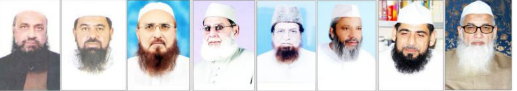
نامور علماء کرام اور دانشوران قوم ملت نے کیا گہر سے رنج و غم کا اظہار مختلف مدارس و تنظیموں کے ذمہ داران نے کیا اظہار تعزیت۔

دیوبندی فضا مغموم، نامور علماء کرام اور دانشوران قوم ملت نے کیا گہر سے رنج و غم کا اظہار مختلف مدارس و تنظیموں کے ذمہ داران نے کی اظہار تعزیت، ایصال ڈوٹاب کی مجالس کا انعقاد