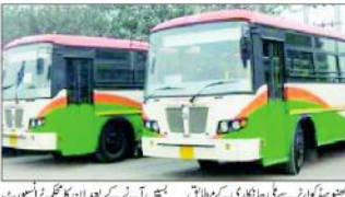
نوئیڈا سے سی این جی کی 15 نئی بسیں چلائی جائیں گی۔

نوئیڈا سے سی این جی کی 15 نئی بسیں چلائی جائیں گی۔ نوئیڈا سے سی این جی کی 15 نئی بسیں چلائی جائیں گی۔ نوئیڈا سے سی این جی کی 15 نئی بسیں چلائی جائیں گی۔ نوئیڈا سے سی این جی کی 15 نئی بسیں چلائی جائیں گی۔