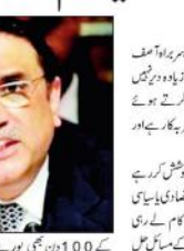
عمران خان نااہل وزیر اعظم، حکومت زیادہ دیر نہیں چلے گی: زررداری

اسلام آباد (ای این آئی) عمران خان نااہل وزیر اعظم، حکومت زیادہ دیر نہیں چلے گی: زررداری نے کہا ہے۔ زررداری نے کہا کہ عمران خان نااہل وزیر اعظم ہیں۔ انہوں نے کہا کہ حکومت زیادہ دیر نہیں چلے گی۔ زررداری نے کہا کہ عمران خان نااہل وزیر اعظم ہیں۔ انہوں نے کہا کہ حکومت زیادہ دیر نہیں چلے گی۔