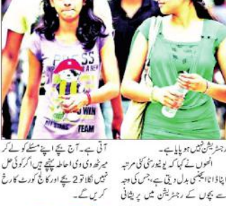
سی سی یو کے پارٹل پریسٹریشن نہ ہونے سے امتحان چھوٹا۔

سی سی یو کے پارٹل پریسٹریشن نہ ہونے سے امتحان چھوٹا۔ سی سی یو کے پارٹل پریسٹریشن نہ ہونے سے امتحان چھوٹا۔ سی سی یو کے پارٹل پریسٹریشن نہ ہونے سے امتحان چھوٹا۔ سی سی یو کے پارٹل پریسٹریشن نہ ہونے سے امتحان چھوٹا۔