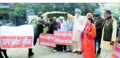
تھانے کے گیٹ پر باندھی بھینس، سادھوی کا انوکھا ڈرامہ۔

تھانے کے گیٹ پر باندھی بھینس، سادھوی کا انوکھا ڈرامہ۔ تھانے کے گیٹ پر باندھی بھینس، سادھوی کا انوکھا ڈرامہ۔ تھانے کے گیٹ پر باندھی بھینس، سادھوی کا انوکھا ڈرامہ۔ تھانے کے گیٹ پر باندھی بھینس، سادھوی کا انوکھا ڈرامہ۔