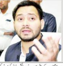
پٹنہ میں ہائی کورٹ کے وکیل کا گولی مار کر قتل کی مخالفت میں ساتھی دکلا عزم لوگوں پر، جام سے لوگ پریشان