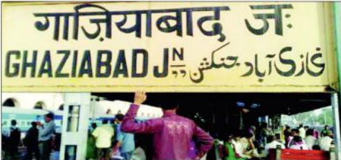
ایک سرکاری اجلاس میں غازی آباد کے لوگوں نے کہا کہ غازی آباد کے نام تبدیل کرنے کی ضرورت ہے۔

غازی آباد (ایجنسیاں) فیض آباد اور الہ آباد کے بعد اب غازی آباد کے نام بھی تبدیل کرنے کی آواز اٹھ رہی ہے۔ یہاں کے لوگوں نے کہا کہ غازی آباد کے نام تبدیل کرنے کی ضرورت ہے۔ ایک سرکاری اجلاس میں غازی آباد کے لوگوں نے کہا کہ غازی آباد کے نام تبدیل کرنے کی ضرورت ہے۔ ایک سرکاری اجلاس میں غازی آباد کے لوگوں نے کہا کہ غازی آباد کے نام تبدیل کرنے کی ضرورت ہے۔ ایک سرکاری اجلاس میں غازی آباد کے لوگوں نے کہا کہ غازی آباد کے نام تبدیل کرنے کی ضرورت ہے۔