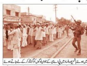
1987 میں سرگرمیوں کے دوران گنگہ گاروں کی ایک گروپ

عدالت نے یوپی پولیس کو بھیجا نوٹس 19 دسمبر تک عمل کرنے کا حکم دیا ہے۔ گنگہ گاروں کو حاضر کرو اور ان کے خلاف کارروائی کرنا۔