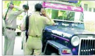
تھانے میں پولیس سے بدسلوکی کے باعث 2 خواتین سمیت 16 افراد گرفتار ہوئے۔

پولیس سے بدسلوکی کے باعث 2 خواتین سمیت 16 افراد گرفتار ہوئے۔ پولیس سے بدسلوکی کے باعث 2 خواتین سمیت 16 افراد گرفتار ہوئے۔ پولیس سے بدسلوکی کے باعث 2 خواتین سمیت 16 افراد گرفتار ہوئے۔ پولیس سے بدسلوکی کے باعث 2 خواتین سمیت 16 افراد گرفتار ہوئے۔