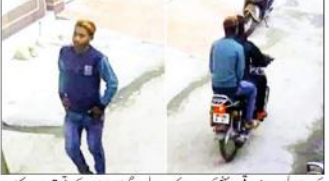
سہارنپور (سید حسن) جگہ کے سانا گائے کے کام پر جوگتا کا بنڈھنچوں نے کیا اور پورے علاقہ میں گائے کو قتل کر کے پھینک کر فساد برپا کیا جس میں ایک پولیس اہلکار سیتھو نے جان کی قربانی دی۔

زہر دے، پانچ بجے جگہ کے شام ہو گئی گائے کو زہر دینے کے لیے علاقہ میں لوگوں نے جگہ شروع کر دیا۔ گائے کو زہر دینے کے لیے علاقہ میں لوگوں نے جگہ شروع کر دیا۔ گائے کو زہر دینے کے لیے علاقہ میں لوگوں نے جگہ شروع کر دیا۔