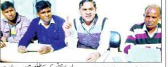
سہارنپور (بی این این) ایس سی ایس ٹی ایکٹ کو ختم کرنے کی سازش کے خلاف قاضی اعظم پر بھیم راؤ امبیڈکر کے مخالف سازش کا الزام۔

ایس سی ایس ٹی ایکٹ کے خلاف سازش کا الزام آئین بچاؤ سمیت قاضی اعظم پر بھیم راؤ امبیڈکر کے مخالف سازش کا الزام۔