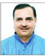
سہارنپور (بی این این) سہارنپور میں ایک شخص کی تصویر۔

دیوبند (ضلع) میں ایک شادی شدہ خاتون کو مارنے کی کوشش کی گئی۔ پولیس نے تفتیش شروع کی ہے۔