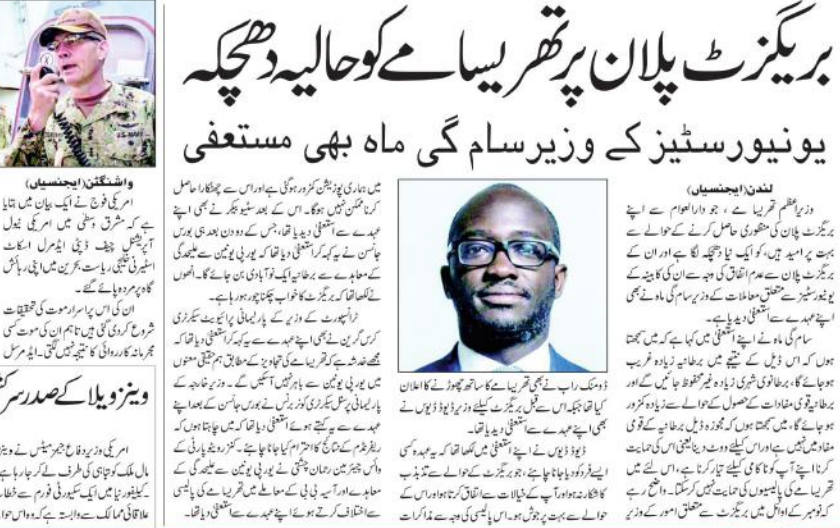
نیو یارک (ایس ایس)