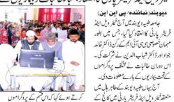
دیوبند (ضلع) میں ایک شخص کی تصویر۔

فیصل آباد کے ایک شخص نے جامعہ طیبہ دیوبند کے فروغ میں اہم رول ادا کیا ہے۔