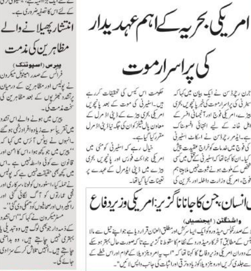
پیرس (ایس ایس)

یونیورسٹیز کے وزیر سام گی ماہ بھی مستعفی ہو گئے۔ بریکنگ نیوز پلان پر تھر سیسے کو حالیہ دھچکے ہو گئے۔ یونیورسٹیز کے وزیر سام گی ماہ بھی مستعفی ہو گئے۔ بریکنگ نیوز پلان پر تھر سیسے کو حالیہ دھچکے ہو گئے۔