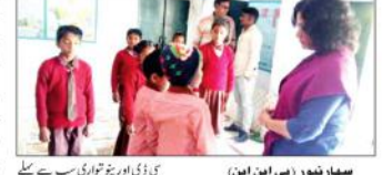
سہارنپور (بی این این) ایک چیف ترقیاتی افسر کا پرائمری اسکول سرکاری اسپتال کا معاملہ ہے۔

سہارنپور (بی این این) ایک چیف ترقیاتی افسر کا پرائمری اسکول سرکاری اسپتال کا معاملہ ہے۔ پولیس نے تفتیش شروع کی ہے۔