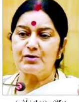
بیگم (پی این این) دہشت گردی کی تنظیموں میں جانوں کو بگاڑ رہی ہیں اور جان بچانے والے جانوں کا استعمال انہیں خالصتاً ایک جگہ سے دوسری جگہ پھیلانے یا دہشت گردی کرنے والے جانوں سے دہشت گردوں کیلئے کام کے طور پر ہے۔

منشی دھلی (پی این این) پاکستانی دہشت گردی کی تنظیم جماعتیں میں جانوں کو دہشت گردی کی طرف سے ہتھیار بنانے کیلئے اپنی ترقی پسند سہارا دے رہی ہیں۔ لیکن سوشل میڈیا کے ذریعہ انہیں خوبصورت خواتین کے ذریعہ جانوں کو بگاڑ رہی ہیں اور جان بچانے والے جانوں کا استعمال انہیں خالصتاً ایک جگہ سے دوسری جگہ پھیلانے یا دہشت گردی کرنے والے جانوں سے دہشت گردوں کیلئے کام کے طور پر ہے۔ پاکستان میں دہشت گردی کی طرف سے ہتھیار بنانے کیلئے اپنی ترقی پسند سہارا دے رہی ہیں۔ لیکن سوشل میڈیا کے ذریعہ انہیں خوبصورت خواتین کے ذریعہ جانوں کو بگاڑ رہی ہیں اور جان بچانے والے جانوں کا استعمال انہیں خالصتاً ایک جگہ سے دوسری جگہ پھیلانے یا دہشت گردی کرنے والے جانوں سے دہشت گردوں کیلئے کام کے طور پر ہے۔ پاکستان میں دہشت گردی کی طرف سے ہتھیار بنانے کیلئے اپنی ترقی پسند سہارا دے رہی ہیں۔ لیکن سوشل میڈیا کے ذریعہ انہیں خوبصورت خواتین کے ذریعہ جانوں کو بگاڑ رہی ہیں اور جان بچانے والے جانوں کا استعمال انہیں خالصتاً ایک جگہ سے دوسری جگہ پھیلانے یا دہشت گردی کرنے والے جانوں سے دہشت گردوں کیلئے کام کے طور پر ہے۔