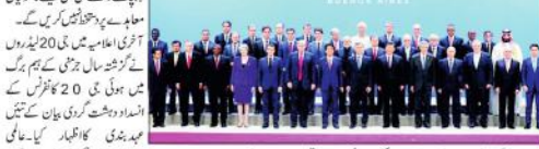
نیو یارک (ایس ایس)

نیو یارک میں جی 20 کا اختتام ہو گیا ہے۔ امریکی صدر ٹرمپ اور دیگر رہنماؤں نے خطاب کیا۔ ٹرمپ نے کہا کہ جی 20 کا اختتام ایک کامیاب اجلاس تھا۔ انہوں نے کہا کہ جی 20 کا اختتام ایک کامیاب اجلاس تھا۔ انہوں نے کہا کہ جی 20 کا اختتام ایک کامیاب اجلاس تھا۔