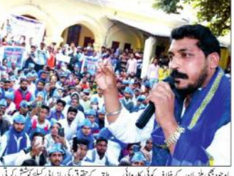
سہارنپور (بی این این) سہارنپور میں دلتوں میں منعقد ہونے والے ایک جلسے میں ایک شخص نے خطاب کیا۔

بھارتی حکومت نے دلتوں کو رہا کرنے کیلئے 'بہیم آرمی' کا مظاہرہ کیا۔ دلتوں کو جیلوں میں بند رکھنا ایک سنگین جرم ہے۔ دلتوں کو رہا کرنے کیلئے 'بہیم آرمی' کا مظاہرہ کیا گیا۔ دلتوں کو رہا کرنے کیلئے 'بہیم آرمی' کا مظاہرہ کیا گیا۔