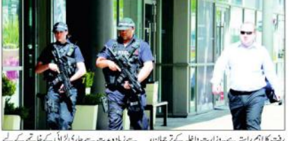
کابل (ایجنسیاں) برطانیہ میں سیکورٹی گروپ کے ہتھیار چھیننے کے واقعے کے بعد برطانوی فوجیوں کی ایک ٹیم کو ہتھیار چھیننے کے لیے بھیجا گیا ہے۔

سرپتی میں مندرہ کافرلس کے احاطے کے باہر افغانی فائبروں کو ہتھیار چھیننے کے طالبان کے ساتھ امن کے قیام پر زور۔ سرپتی میں مندرہ کافرلس کے احاطے کے باہر افغانی فائبروں کو ہتھیار چھیننے کے طالبان کے ساتھ امن کے قیام پر زور۔