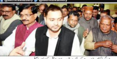
پندرہ روزہ کوہ پورہ میں ہونے والے اجلاس میں شرکت کرنے والے اراکین