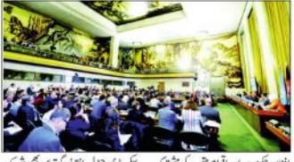
جنیوا کانفرنس کے دوران ایک اجلاس کی تصویر۔

62 ملکوں کے وزرائے خارجہ، اعلیٰ حکام، 35 بین الاقوامی تنظیموں کے اعلیٰ سطحی وفدوں کے شرکاء