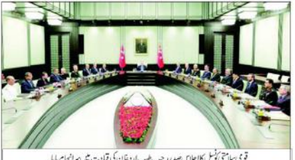
قومی سلامتی کونسل کا اجلاس صدر رجب طیب اردغان کی قیادت میں منعقد ہوا۔

قومی سلامتی کونسل کا اجلاس رجب طیب اردغان کی صدارت میں اختتام پذیر