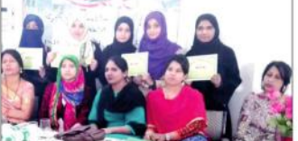
سیدرت نبوی (میں امین (این) کی ایک تصویر)