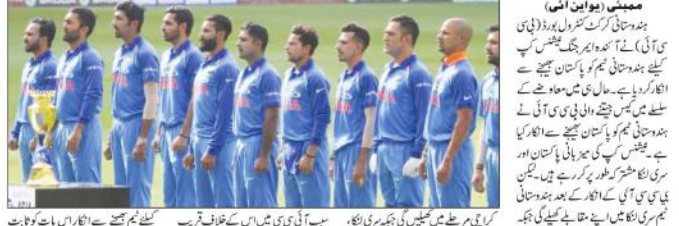
پاکستان کرکٹ بورڈ نے بی سی سی آئی سے کہا کہ وہ ہندوستانی ٹیم کو پاکستان بھیجنے سے انکار کر دے گا۔

بی سی سی آئی نے کہا کہ وہ ہندوستانی ٹیم کو پاکستان بھیجنے سے انکار کر دے گا۔ انہوں نے کہا کہ وہ ہندوستانی ٹیم کو پاکستان بھیجنے سے انکار کر دے گا۔