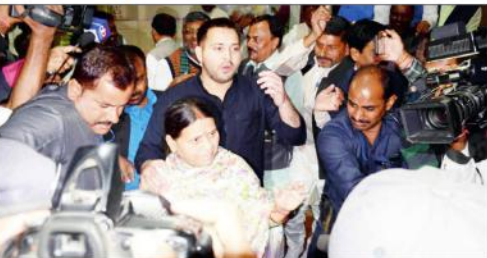
پٹنہ ڈی ایئر ٹرمینل پر ڈی ایئر اور ایئر لائنز کی ایئر لائنز میں نشست حکومت کے خلاف مظاہر کرنے والے۔