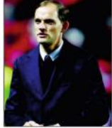
پیووس (پوین آئی) جس سٹیٹ برزین (پی ایس بی) کے چیمپئن لیگ کے خلاف وہیٹی ٹیبلے کے دوران ٹیبلے کے پارٹنر شپ کے ساتھ ساتھ پی ایس جی کے لیے چیلنج سنبھالیں گے۔

دہلی، 29 نومبر (پوین آئی)۔ نیما اور ایم بایے چیمپئن لیگ میں پی ایس جی کا چیلنج سنبھالیں گے۔ تھامس نے کہا کہ وہ پی ایس جی کے خلاف ٹیبلے کے پارٹنر شپ کے ساتھ ساتھ پی ایس جی کے لیے چیلنج سنبھالیں گے۔