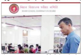
بہار اسکول ایگزیمین بورڈ کے ڈیپٹی چیئرمین کی طرف سے جاری نوٹیفیکیشن کی تصویر۔

فیس 6 دسمبر سے 20 دسمبر تک کیا جائے گا منظور