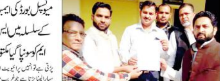
دیوبند (ضمانتہ) میں امین (این) کی ایک تصویر

سرسید احمد خاں کی تعلیمی اور سوشل خدمات کیلئے عظیم تر! سرسید نبوی (میں امین (این) کی ایک تصویر) سرسید احمد خاں کی تعلیمی اور سوشل خدمات کیلئے عظیم تر!