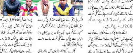
سہارنپور (میں امین (این) کی ایک تصویر)

پکڑے گئے جعل سازوں کے پاس سے 3.5 لاکھ اور اسکیپن پرنٹر برآمد