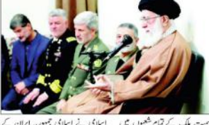
ایران کے وزیر خارجہ اور دیگر اعلیٰ حکام کی پریس کانفرنس۔

دشمن ایرانی قوم کو دھمکی دینے کی جرت نہ کر سکے