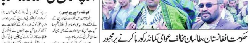
افغانستان کی حکومت

کابل (ایجنسیاں) افغانستان کی حکومت نے طالبان مخالف عوامی کانڈرگورہ کرنے پر مجبور ہو گیا۔ افغانستان کی حکومت نے طالبان مخالف عوامی کانڈرگورہ کرنے پر مجبور ہو گیا۔ افغانستان کی حکومت نے طالبان مخالف عوامی کانڈرگورہ کرنے پر مجبور ہو گیا۔