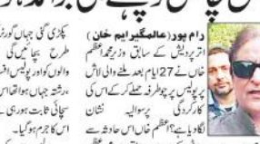
پولیس کی چال کو رد کرتی تھی۔ مارشلنگ تھی۔ اس کے باوجود پولیس نے پائل کو برآمد نہیں کیا۔

پولیس کی چال کو رد کرتی تھی۔ مارشلنگ تھی۔ اس کے باوجود پولیس نے پائل کو برآمد نہیں کیا۔ اس کی وجہ سے عظیم جشن عید میلاد النبی صلی اللہ علیہ وسلم کی مناسبتاً پولیس کی چال کو رد کرتی تھی۔