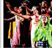
اردو اکادمی کے اردو ڈرامہ فیسٹول کے تیسرے روز 'جلیان والا باغ' کی پیشکش

پروفیسر شبر سول نے کہا کہ 'جلیان والا باغ' ایک تاریخی اور جذباتی ڈرامہ ہے جس کی کہانی 1919ء کی آواز کی یاد دلاتی ہے۔ اس ڈرامے کے ذریعہ نیشنل ٹریڈ پورٹ 350 کلو واٹر گاڑنے