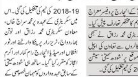
شودھ سمیتی کے اجلاس میں 'شودھ سمیتی' کے اراکین نے شرکت کی۔

2018-19 کی کمی کی تکمیل کی۔ اس میں سرکاری کے عہدہ پر موجود تمام مسلمان سرکاری عہدہ داروں اور فوجی افسانوں اور پولیس افسانوں کی شرکت ہوئی۔