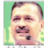
کجر یوال کے قتل کی سازش کے بارے میں ایک نیا ٹریڈ انٹینس کمپ کا انعقاد کیا گیا ہے۔