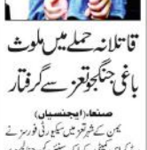
سعودی ولی عہد

انقرہ (ایجنسیاں) ترکی وزیر خارجہ نے کہا کہ اردگان رہنما اور دفتر اردگان کے دارالحکومت انکارا میں ہونے والے ملاقاتوں میں 20 مئی کو ملاقات کے سربراہ اردگان میں شریک ہونے کی توقع ہے۔ سعودی ولی عہد نے ترکی سے ملاقات کے خواہشمند ہیں۔ سعودی ولی عہد نے ترکی سے ملاقات کے خواہشمند ہیں۔ سعودی ولی عہد نے ترکی سے ملاقات کے خواہشمند ہیں۔