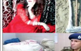
پائل کا قاتل اس کا منگیتر جہانگیر۔ اس کی شادی کے بعد اس کا قاتل اس کا منگیتر جہانگیر بنا گیا۔

پائل کا قاتل اس کا منگیتر جہانگیر۔ اس کی شادی کے بعد اس کا قاتل اس کا منگیتر جہانگیر بنا گیا۔ اس کی شادی کے بعد اس کا قاتل اس کا منگیتر جہانگیر بنا گیا۔