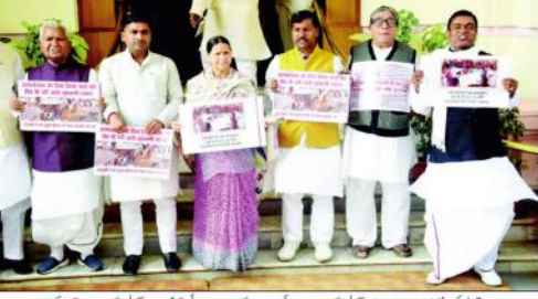
پندرہ ماہرین ایگزیکٹو کی منتہی راجیو دیوی آہلی کے دوا سہائی اہلسان کے دوران پائی کے سربراہ اہلسان کے ساتھ...