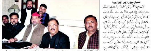
ایکشن کمیشن کو پیش کردہ نوٹوں میں ایس پی ایم اے کے الزامات کی وضاحت کی گئی ہے۔ اس میں مسلمانوں کے ووٹ کاٹنے کی سازش کی اطلاع دی گئی ہے۔

ایس پی ایم اے کی ایکشن کمیشن کو عرضداشت، ضلع انتظامیہ پر عائد کیا الزام پہلو لوک سبھا ایکشن میں مسلمانوں کے ووٹ کاٹنے کیلئے لی ایل او پر دیا