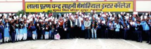
لالا لالہ پران چاند ساہنی میموریل گنٹر کالج میں منعقد ہونے والے مذہبی پروگرام کی تصویر۔