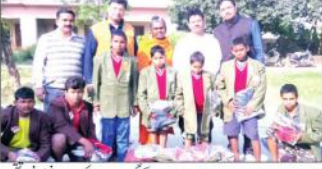
مقامی اور ضرورت مند بچوں کے لئے گرم کپڑے تقسیم کیے گئے۔ اس موقع پر غریبوں کی حالت پر غور کیا گیا۔