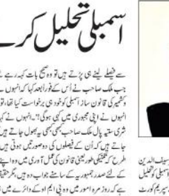
سرسری ہٹو (ایم این این)