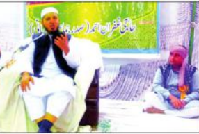
امروہہ (سالانہ غازی) آج مسلمان بچپن سے سو رہ گئے۔ بیٹوں کی طرح ہم نے بھی شادی کو تفریح اور محض رسم و رواج سمجھ لیا۔

ایک ایسے دور میں جب کہ ہر شے کی قیمت بڑھ رہی ہے اور انسان کی بنیادی ضرورتیں فروخت ہوتی ہیں۔ اس لیے شادی کو تفریح اور محض رسم و رواج سمجھنا بے حیائی اور بے شرمی کی علامت ہے۔