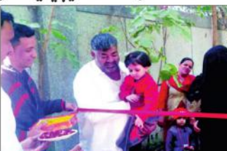
بہن شکیلہ نے کیا 22 لاکھ کے ترقیاتی کاموں کا افتتاح کرتے ہوئے۔

دہلی اسمبلی کی کراؤٹی سے باہر، مجن شکیلہ نے کیا 22 لاکھ کے ترقیاتی کاموں کا افتتاح۔ اسکولوں کی ترقی پر خرچ کیے جائیں گے 7 لاکھ 81 ہزار اور ساڑھے 14 لاکھ کی لاگت سے بنایا جا رہا گیانا کواڑ گاؤں۔