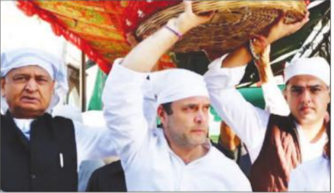
راجستھان کے سرکار نے 10 دن میں قرضہ معاف

پہاڑیوں نے ہندوؤں کو چھوڑا ہندوؤں کو مارا: تنہا گت