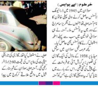
ڈرامائیگ لائسنس حاصل کرنے والی اولین خاتون کی گاڑی۔

ڈرامائیگ لائسنس حاصل کرنے والی اولین خاتون کی گاڑی۔ ڈرامائیگ لائسنس حاصل کرنے والی اولین خاتون کی گاڑی۔