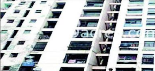
ویشالی (وی این این) دہلی بنگلہ 4 کے لاکھوں روپے کی اپارٹمنٹ میں جی ڈی اے کے تقریباً 40 سے زائد فلیٹس 20 سال سے خالی ہیں۔

ویشالی (وی این این) دہلی بنگلہ 4 کے لاکھوں روپے کی اپارٹمنٹ میں جی ڈی اے کے تقریباً 40 سے زائد فلیٹس 20 سال سے خالی ہیں۔ سال 93-93 میں لاکھوں روپے خرچ کرنے کے بعد جی ڈی اے نے فلیٹس تیار کرنے میں تاخیر کی ہے۔ دہلی میں ایک سرکاری جی ڈی اے نے دوبارہ ان فلیٹوں کو الاٹ کرنے کی کوشش کی لیکن یہ تمام فلیٹس ہوائی ٹیکنیکل کی ڈی اے کے زیر نگرانی تیار کیے گئے تھے۔