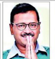
دہلی اسمبلی کی کراؤٹی سے باہر، وزیر اعظم مودی سے ملا ایمانداری کا شکر اظہار۔

دہلی اسمبلی کی کراؤٹی سے باہر، تخو اہوں میں اضافہ کیلئے دہلی وقف بورڈ پر دباؤ۔ تخو اہوں میں اضافہ کیلئے دہلی وقف بورڈ پر دباؤ۔ تخو اہوں میں اضافہ کیلئے دہلی وقف بورڈ پر دباؤ۔