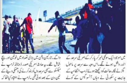
امریکہ کی فوجی دستوں نے سرحد کو بند کر دیا گیا۔

میکسیکو (پی این این) امریکہ میکسیکو سرحد پر کشیدگی کا خاتمہ ہونے کے بعد سرحد کو بند کر دیا گیا۔ میکسیکو کی سرحدوں پر امریکہ کی فوجی دستوں کی موجودگی کی اطلاع ملنے کے بعد امریکہ کی فوجی دستوں نے سرحد کو بند کر دیا گیا۔ امریکہ کی فوجی دستوں نے سرحد کو بند کر دیا گیا۔