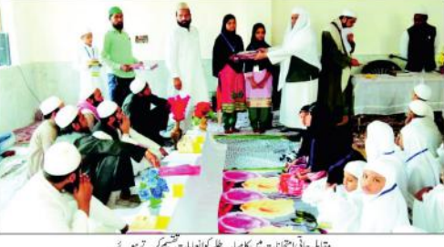
تبادلہ چاہتی انتخابات کا مکیابھی کامیاب انتخابات ختم کرتے ہوئے۔

دہلی اسمبلی کی کراؤٹی سے باہر، خواتین ارکان اسمبلی بھی نظر آئیں سو مناتہ بھارتی کے ساتھ۔ کراؤٹی کے باہر کراؤٹی سے باہر، خواتین ارکان اسمبلی بھی نظر آئیں سو مناتہ بھارتی کے ساتھ۔ کراؤٹی کے باہر کراؤٹی سے باہر، خواتین ارکان اسمبلی بھی نظر آئیں سو مناتہ بھارتی کے ساتھ۔