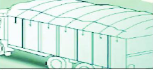
غازی آباد: (وی این این) موٹروں اور ٹریکس کی جانب سے سامان چھیننے کے ہم پر پھینکی گئی ہے۔