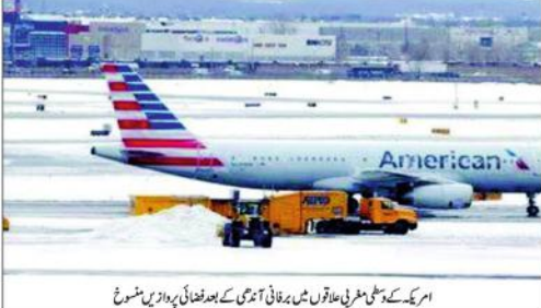
امریکہ کے سٹیٹن مین علاقوں میں برقی انٹراپ کے بعد لفظی پروازیں منسوخ

امریکہ میں برقی انٹراپ، 1240 پروازیں منسوخ بہت سے مسافر برقی انٹراپ کے باعث امریکہ میں پروازیں منسوخ ہیں۔ امریکہ میں Weather National Service کے ایک ایئر ہاپ اور ایک کے ساتھ ساتھ 15 سے زائد ہوائی کمپنیوں نے پروازیں منسوخ کر دی ہیں۔ امریکہ میں ہوائی کمپنیوں نے 1240 پروازیں منسوخ کر دی ہیں۔ امریکہ میں ہوائی کمپنیوں نے 1240 پروازیں منسوخ کر دی ہیں۔ امریکہ میں ہوائی کمپنیوں نے 1240 پروازیں منسوخ کر دی ہیں۔