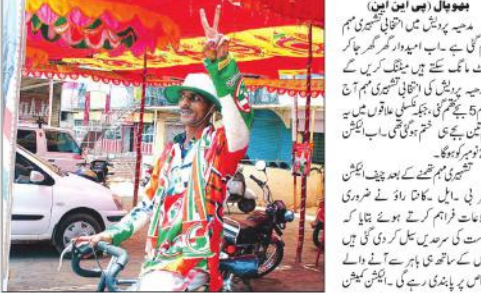
ہو پھول (سی این این) مدھیہ پردیش میں کانگریس کی مہم کے لیے ایک امیدوار گھر گھر جا کر...