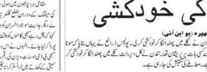
نوجوان کی خودکشی

نوجوان کی خودکشی۔ نوجوان نے خودکشی کی ہے۔