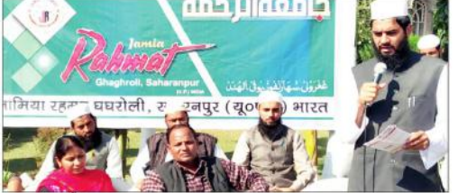
سہارنپور (بی این این)۔ خسرہ، روپیلا جیسا کہ نیا دہلی کے دیگر شہروں میں بھی ہوتا ہے، جہاں آٹا، چائے اور دیگر غذائی اجزاء کی کمی کی وجہ سے بچوں کی موت ہوتی ہے۔

نئی دہلی، 23 نومبر (ایس ایم ایف)۔ خسرہ، روپیلا سے ہر سال 42,200 بچوں کی موت ہوتی ہے۔ اس کی روک تھام کے لیے طبی دانوں کی مدد سے لاکھوں بچوں کی جان بچائی جا سکتی ہے۔