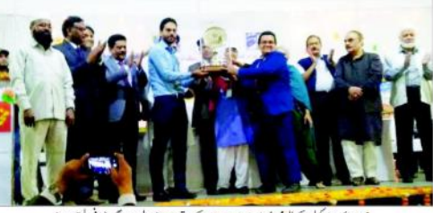
نیوہورائزن اسکول کے طلبہ چیف ایگزیکٹو آفیسر اور ایم اے کے ساتھ نیا نیا تعمیر شدہ راتھی لائے ہوئے