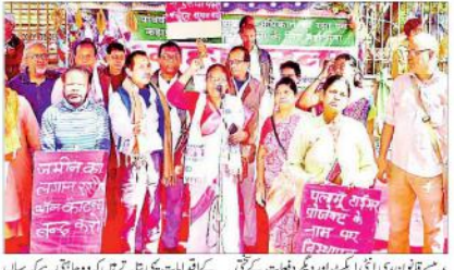
پانچویں فہرست کے تحت سب کو کھانا، خالص ہوا، پانی، تعلیم اور احترام

جھارکھنڈ میں پانچویں فہرست کے تحت سب کو کھانا، خالص ہوا، پانی، تعلیم اور احترام کے لیے لوگ مظاہرہ کر رہے ہیں۔ مظاہرین نے راج بھون کے سامنے ایک پٹی باندھ کر اس پر 'پانچویں فہرست کے تحت سب کو کھانا، خالص ہوا، پانی، تعلیم اور احترام' لکھا ہے۔ مظاہرین نے کہا کہ حکومت کو اس فہرست کے تحت سب کو کھانا، خالص ہوا، پانی، تعلیم اور احترام فراہم کرنا چاہیے۔