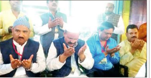
اور پورہ میں مسیحی عوام کے ساتھ مل کر منظر پر اتر پردیش کے مسیحی عوام نے اپنی کامیابیوں کا اظہار کیا۔

لکھنؤ (ایجنسیاں) - اتر پردیش کی راجت اور سیٹی کے خلاف کارروائی کے دوران ہی اس کی مدد سے عمارت کو کھال کر چھٹا کر دیا گیا۔ عمارت کے خلاف کارروائی کے دوران ہی اس کی مدد سے عمارت کو کھال کر چھٹا کر دیا گیا۔