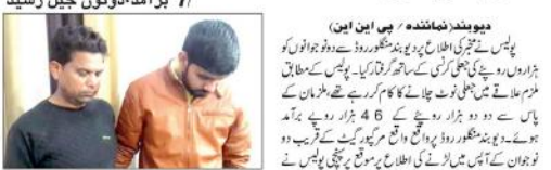
دو سو ہزار روپیہ کے جعلی کرنسی نوٹوں کے سات 2 گرفتار

دو سو ہزار روپیہ کے جعلی کرنسی نوٹوں کے سات 2 گرفتار دو سو ہزار روپیہ کے جعلی کرنسی نوٹوں کے سات 2 گرفتار دو سو ہزار روپیہ کے جعلی کرنسی نوٹوں کے سات 2 گرفتار