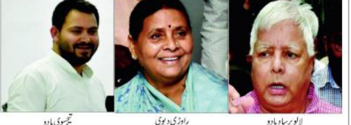
الو پراسادیہ، راجدھنی، تجسوی یادو