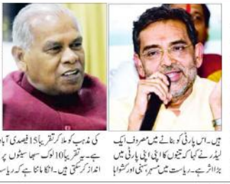
پتھہ (بی این این) بہار میں تیسری بار انتخابات کی تیاریاں...