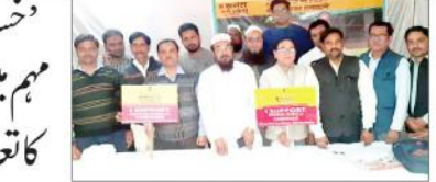
دیوبند ضلع میں ایس این ایم کے سرکردہ افراد پر چھاپی گئی۔

ملک کے موجودہ حالات اور حکومت کی خاموشی انتہائی تشویشناک۔