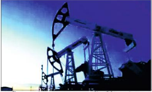
نئی دہلی: (ای این این) موجودہ وقت میں بے گولیا کے تیل کی قیمتیں طے کرنے سے اب تیل کی قیمتیں گریں گی۔

اشارہ دیا ہے۔ روس کا بھرتہ تیل کی آمد بہت کم اٹھارہ کر رہا ہے۔ جن ممالک نے اس وقت تیل کی قیمت طے کرنے کا فیصلہ کیا ہے وہ سعودی عرب کے منصوبے کی حمایت کرنے سے بھلا ہیں۔