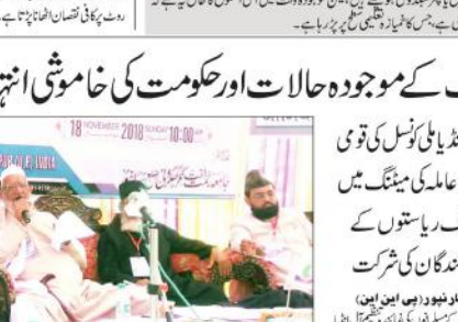
تعلیمی اداروں کے سرکار سے ملنے والے تدریس کے عمل کو نظر انداز کر کے۔

تعلیمی اداروں کے سرکار سے ملنے والے تدریس کے عمل کو نظر انداز کر کے