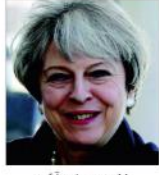
لندن: (یو این آئی) بریگزٹ معاملہ پر برطانوی حکومت کی ٹیلی ویژن پارٹی میں برطانوی وزیر اعظم ٹریزا می نے کہا ہے کہ برطانیہ کو برطانیہ کا خطرہ ہے۔

برطانوی وزیر اعظم ٹریزا می نے کہا ہے کہ برطانیہ کو برطانیہ کا خطرہ ہے۔