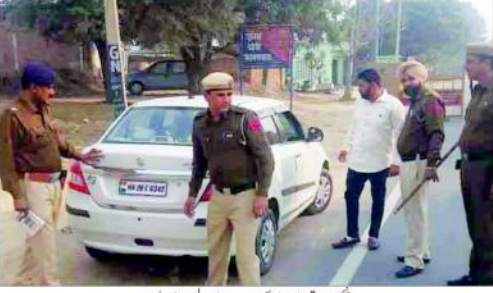
پنچائت اور مرکز میں علی کے بعد ریان میں پولیس ایک بار بار

نئی دہلی، جنس ویلی وکریس کے صدر... بھارت کوئی ایک سچی رہنما تھیں۔ اندرا گاندھی کے ولادت پر پیش کی گئی خراج عقیدت۔