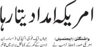
واشنگٹن: (ای این این) امریکی صدر ڈونلڈ ٹرمپ نے کہا ہے کہ وہ پاکستان کو دیتار ہادھوکہ دے گا۔