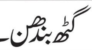
اقتصادی بحران سے نکلانے میں نہیں کی زمین نے مدد P9