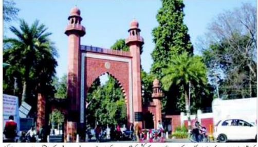
مجلس گزشتہ یوم این این میں سچ کی آواز کے ایمریو میں نقشہ کو لیکر تنازع کے خلاف منسوخ ڈرامہ منسوخ کیا گیا۔

بی جے پی سرگرم، معاملہ وزارت فروغ انسانی وسائل لے جانے کی تیاری