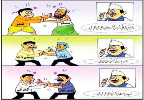
ہرم کی آزادی شروع کر دی، بی بی پی سی۔ ذات پات کی آزادی، بی بی پی سی۔ اب باہر کی آزادی، بی بی پی سی۔