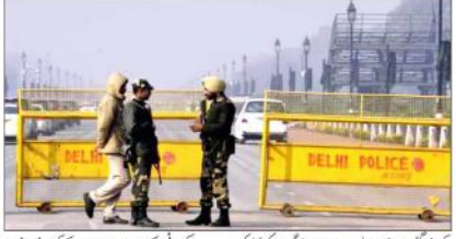
گدی کی اور ہم مہولیت دہلی اور ڈاک اسٹاکس کی سیکورٹی کے لیے بڑے بندوبست کے لیے ہائی الرٹ میں پولیس کی تعیناتی کی گئی ہے۔

مذہبی مقامات پر زیادہ آمدورفت والی جگہوں پر سیکورٹی فورسز کی 20 کمپنیاں فوجی جوان تعینات