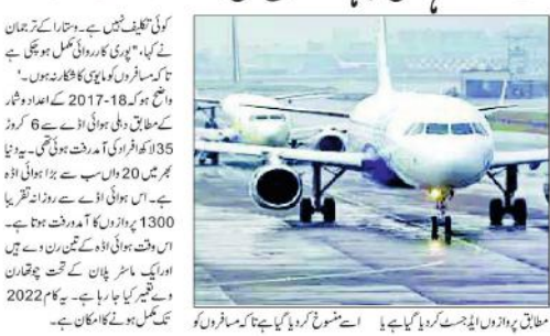
ایئر پورٹ رن وے کی مرمت کے دوران جہازوں کی آمدورفت متاثر ہوگی۔

نئی دہلی: (پریس این) ایئر پورٹ رن وے کی مرمت کے دوران جہازوں کی آمدورفت متاثر ہوگی۔ اس کے تحت ایئر پورٹ رن وے کی مرمت کے دوران جہازوں کی آمدورفت متاثر ہوگی۔