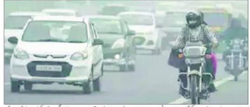
پٹرول و ڈیزل گاڑیوں کو بند کرنے کا فیصلہ کیا گیا ہے۔

نئی دہلی: (ایجنسیاں) اتھارٹی این سی آر کے پٹرول و ڈیزل گاڑیوں کو بند کرنے کا فیصلہ کیا گیا ہے۔ اس کے تحت پٹرول و ڈیزل گاڑیوں کو بند کرنے کا فیصلہ کیا گیا ہے۔ اس کے تحت پٹرول و ڈیزل گاڑیوں کو بند کرنے کا فیصلہ کیا گیا ہے۔