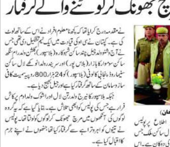
دوم بود اعظمگیر ایم خان انڈیا پریس کے قتل کے بعد مہاراشٹر میں پولیس نے کلبھاشی مارکر کے قتل کی تحقیقات شروع کر دی ہیں۔

آنکھوں میں مرچ جھونک کر لوٹنے والے گرفتار۔ آنکھوں میں مرچ جھونک کر لوٹنے والے گرفتار۔