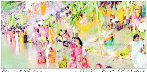
بھار شریف (بی این این) آوارہ کن سے تہوار کا شروع ہو گیا اور شہر کے مختلف علاقوں میں منعقد کیے جانے والے تہوار کے موقع پر لوگوں کی بڑی تعداد نے شرکت کی۔

تہوار کے دوران شہر میں سخت ترین نظم و نسق کا انتظام کیا گیا۔ پولیس اور دیگر اہل ذمہ داریوں نے سختی سے پابندی رکھی۔ شہر کے مختلف علاقوں میں منعقد کیے جانے والے تہوار کے موقع پر لوگوں کی بڑی تعداد نے شرکت کی۔