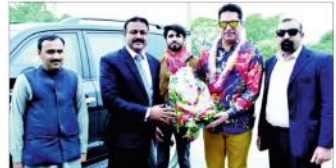
دوم بود اعظمگیر ایم خان سابق وزیر اعلیٰ کاظم علی خان نوپرمیوں پاکستان میں سابق۔ میو ایل کی پرم کینڈا رشوت کرنے والے سابق پٹیل ہندوستانی ہو گئے۔

کاظم علی پاکستان میں 'کینڈا رشوت' کرنے والے لوہین ہندوستانی۔ کاظم علی پاکستان میں 'کینڈا رشوت' کرنے والے لوہین ہندوستانی۔