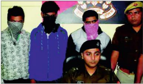
غازی آباد ہانچک چور اور لوٹ مار کرنے والے 3 دہشت گردوں کو پولیس نے گولی مار دی۔