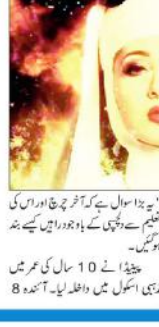
بن گئی دنیا کی سب سے مشہور پورن اسٹار

بن گئی دنیا کی سب سے مشہور پورن اسٹار ہے۔ اسٹار نے کہا کہ دنیا کی سب سے مشہور پورن اسٹار ہے۔