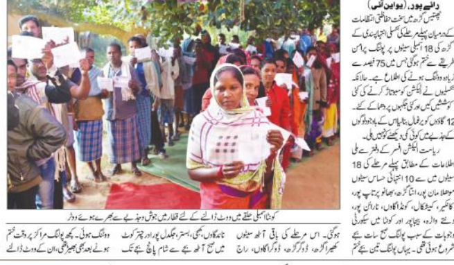
کھیلوں نے 12 گاؤں کو بنایا یرنگال، کئی جگہوں پر دھماکے، عوام نے دکھایا کمال