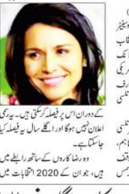
واشنگٹن (ایجنٹس) امریکی کنگرس میں تسی گبارڈ کی تصویر

ہندو نژاد تسی گبارڈ صدر عہدہ کے لئے امیدوار ہو سکتی ہیں۔ تسی گبارڈ نے کہا کہ ہندو نژاد تسی گبارڈ صدر عہدہ کے لئے امیدوار ہو سکتی ہیں۔