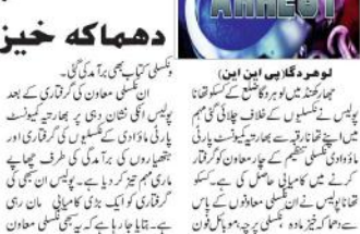
لوہر دگا میں چار نکلسلی گرفتار کیے گئے۔ ان کے پاس دھماکہ خیز مادہ برآمد کیا گیا۔