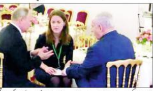
پیرس (ایجنٹس) اور اسرائیلی وزیر اعظم بےنتن آزار کو امریکی صدر ٹرمپ سے تین نے ملاقات کی۔

یہاں پہلی بار تین نے شام میں تین کے ساتھ ملاقات کی۔ تین نے کہا کہ شام میں تین کے ساتھ ملاقات کی۔ تین نے کہا کہ شام میں تین کے ساتھ ملاقات کی۔