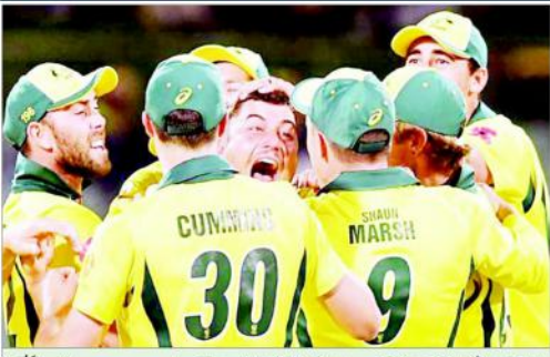
آسٹریلیا کی ٹیم نے انگلینڈ کے خلاف ہندوستان کے خلاف جیت کے بعد خوشیاں مناتے ہوئے۔