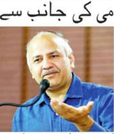
نئی دہلی (انور حسین جعفری) اردو دہلی اردو اکادمی کی جانب سے جشن وراثت اردو کا انعقاد۔ سوسو دا دہلی اردو اکادمی کی جانب سے جشن وراثت اردو کا انعقاد۔

اردو دہلی کی مشترکہ تہذیب کی ایک نمایاں علامت: سوسو دا دہلی اردو اکادمی کی جانب سے جشن وراثت اردو کا انعقاد۔ سوسو دا دہلی اردو اکادمی کی جانب سے جشن وراثت اردو کا انعقاد۔ سوسو دا دہلی اردو اکادمی کی جانب سے جشن وراثت اردو کا انعقاد۔