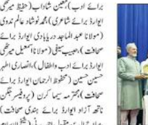
نئی دہلی (ای این این) مختلف میدان میں نمایاں خدمات دینے والی شخصیات کو عالمی یوم اردو ایوارڈ سے نوازا گیا۔ مختلف میدان میں نمایاں خدمات دینے والی شخصیات کو عالمی یوم اردو ایوارڈ سے نوازا گیا۔

مختلف میدان میں نمایاں خدمات دینے والی شخصیات کو عالمی یوم اردو ایوارڈ سے نوازا گیا۔ مختلف میدان میں نمایاں خدمات دینے والی شخصیات کو عالمی یوم اردو ایوارڈ سے نوازا گیا۔