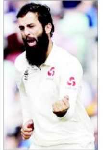
معین علی کی شاندار گیند بازی، سری لنکا کی 211 رنوں سے شکست

معین علی نے اپنی تاریخی جیت کے لیے ایک ایک باؤلنگ کے ساتھ ساتھ 150 وکٹیں حاصل کر کے اپنی تاریخ رقم کی۔