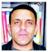
مقبوضہ بیت المقدس (ایجنسیوں) اسرائیلی فوج کی فائرنگوں کے نتیجے میں فلسطینی گورنر کی موت ہو گئی ہے۔

کلیفورنیا (ایجنسیوں) پالیس نے تصدیق کی ہے کہ ایک فائرنگ کرنے والے سابق فوجی کی شناخت کرنے میں کامیاب ہو گیا ہے۔ اس شخص کی شناخت کرنے میں 14 ماہ لگے۔ اس شخص نے ایک فائرنگ کرنے والے سابق فوجی کی شناخت کرنے میں کامیاب ہو گیا ہے۔ اس شخص کی شناخت کرنے میں 14 ماہ لگے۔ اس شخص نے ایک فائرنگ کرنے والے سابق فوجی کی شناخت کرنے میں کامیاب ہو گیا ہے۔