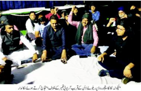
تہواروں کا ہنگامہ بھڑور ڈیڑھ بجے کے آدھے گھنٹے کے خلاف احتجاج کرتے ہوئے ناکار

دلی کے تہواروں پر دلی کی ڈی ٹی سی اور گلشن سوسل میں خواتین نے کیا مفت سفر، میٹرو میں بھی خاصی بھیڑ فضائی آلودگی کا شریاحوں پر رہا ہاشاثر۔ تہواروں کے دوران بھی تہوار پر آج دلی کے سیاسی مقامات پر ہزاروں کیلئے جہازوں کو منظر پر لائے جانے لگے۔ قلب چار، گرہا، ہاشا، گاہک، بک مندر، جہاں کا مقبرہ اور دیگر سیاسی مقامات سمیت دیگر سیاسی مقامات دوبارہ دلی کے تہواروں میں تہواروں کی ایک نئی جہت بن گئی ہے۔