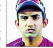
تیسرا ونڈے میچ بھی پاکستان نے جیت لیا۔ پہلے ٹیسٹ میں انہوں نے ویسٹ انڈیز کے لیے بڑا ٹکٹ پر کوئی موقع نہیں دیا۔

بڑھتی ہوئی آلودگی پر گیمبر کا طنز۔ بڑھتی ہوئی آلودگی پر گیمبر کا طنز۔ بڑھتی ہوئی آلودگی پر گیمبر کا طنز۔ بڑھتی ہوئی آلودگی پر گیمبر کا طنز۔