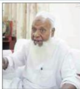
کشن گپتھ (یو این این)

کشن گپتھ (یو این این) نے کہا کہ حکومت کو اس مسئلے کو سنجیدگی سے دیکھنا چاہیے۔