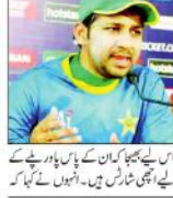
تیسرا ونڈے میچ بھی پاکستان نے جیت لیا۔ پہلے ٹیسٹ میں انہوں نے ویسٹ انڈیز کے لیے بڑا ٹکٹ پر کوئی موقع نہیں دیا۔

گیند بازوں نے بہت اچھی بالنگ کا کیا مظاہرہ۔ گیند بازوں نے بہت اچھی بالنگ کا کیا مظاہرہ۔ گیند بازوں نے بہت اچھی بالنگ کا کیا مظاہرہ۔ گیند بازوں نے بہت اچھی بالنگ کا کیا مظاہرہ۔