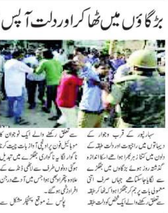
دو دنوں طرف سے ہونے والے احتجاج کے دوران بڑگاؤں میں ٹھاٹھا کر اور دولت آپس میں متصادم ہو گئے۔

دو دنوں طرف سے ہونے والے احتجاج کے دوران بڑگاؤں میں ٹھاٹھا کر اور دولت آپس میں متصادم ہو گئے۔ دو دنوں طرف سے ہونے والے احتجاج کے دوران بڑگاؤں میں ٹھاٹھا کر اور دولت آپس میں متصادم ہو گئے۔