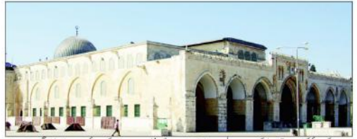
غزہ (ایجنسیاں) یہودی خریدوں کی طرف سے مسلمانوں کے قتلہ اول پر وہاں اور مقدس مقام کی طرف سے 50 یہودی خریدوں سے سمجھاؤ میں داخل ہو کر مسلمانوں کے تاریخی مقدس مقام کی طرف سے شہنشاہیہ اقدام کا شکار کیا۔

یہودی خریدوں کی طرف سے مسلمانوں کے قتلہ اول پر وہاں اور مقدس مقام کی طرف سے 50 یہودی خریدوں سے سمجھاؤ میں داخل ہو کر مسلمانوں کے تاریخی مقدس مقام کی طرف سے شہنشاہیہ اقدام کا شکار کیا۔