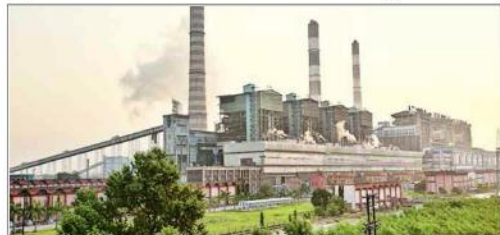
پارک کوئلہ کے ذخیرہ کے بغیر پھر 2340 میگاواٹ کی پیداوار کی جگہ فریب ہے۔ اس طرح فریب 600 میگاواٹ بجلی کی کوئی کرلی پڑی ہے۔ دراصل 1750 میگاواٹ بجلی کی پیداوار جاری ہے۔

بھارت کی اہم ترین بجلی کی کمپنی این ٹی پی سی نے اپنے ایک اہم ترین پاور پلانٹ پارک کوئلہ کے ذخیرہ کے بغیر پھر 2340 میگاواٹ کی پیداوار کی جگہ فریب ہے۔ اس طرح فریب 600 میگاواٹ بجلی کی کوئی کرلی پڑی ہے۔ دراصل 1750 میگاواٹ بجلی کی پیداوار جاری ہے۔