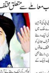
خادم حسین رضوی کی تحریک لبیک کے سربراہ خادم حسین رضوی (ایجنسیا)۔

صنعتی (ایجنسیا)۔ حوشیوں کے اہم فیئڈ کمائڈر کے طور پر کام کرنے والے ایک شخص کو گرفتار کیا گیا۔