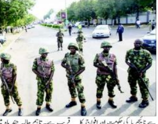
فوجیوں کا ایک دستہ۔ ناہنجیریا میں فوجی اڈوں پر حملوں میں اضافہ ہوا ہے۔

مملکت اور شہر بھوٹا جی کے قتلے میں سے جہاں جانی نقصان میں بعد پورا گاؤں دہشت گردوں کے اضافی حملے ہوئے۔