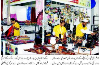
دہلی میں ہونے والے بین الاقوامی تجارتی میلے میں 22 ریاستوں سے آنے والے دست کاروں، فن کاروں اور کاریگروں نے حصہ لیا۔

دہلی میں ہونے والے بین الاقوامی تجارتی میلے میں 22 ریاستوں سے آنے والے دست کاروں، فن کاروں اور کاریگروں نے حصہ لیا۔ دہلی میں ہونے والے بین الاقوامی تجارتی میلے میں 22 ریاستوں سے آنے والے دست کاروں، فن کاروں اور کاریگروں نے حصہ لیا۔