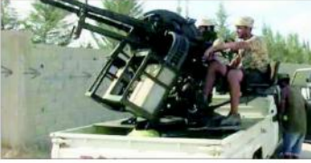
فوجیوں کے ہتھیار