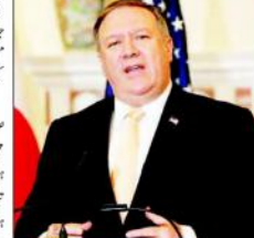
پوپ فرانسس نے ایران کی معیشت کو تباہ کرنے کے لیے کہا ہے۔ انہوں نے کہا کہ ایران کی معیشت کو تباہ کرنے کے لیے کہا ہے۔

پوپ فرانسس نے ایران کی معیشت کو تباہ کرنے کے لیے کہا ہے۔ انہوں نے کہا کہ ایران کی معیشت کو تباہ کرنے کے لیے کہا ہے۔ انہوں نے کہا کہ ایران کی معیشت کو تباہ کرنے کے لیے کہا ہے۔