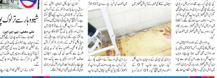
آپریشن تھیرپو میں نکلنا سناپ، پھیلی افراتفری... ہسپتال کے باہر ہنگامہ مچ گیا۔