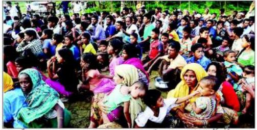
مئی میں ہونے والی سٹی کے جلسہ میں میاٹھا اور بنگلہ دیش نے نومبر 2017 میں دہشت گردی کے خلاف پابندی لگانے پر اتفاق کیا۔

میانمار اور بنگلہ دیش میں روہنگیا مہاجرین کی وطن واپسی پر اتفاق