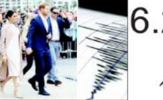
ایک گروپ آف لوگ جو ایک تقریب میں حصہ لے رہے ہیں۔ انہوں نے کہا کہ ایک گروپ آف لوگ جو ایک تقریب میں حصہ لے رہے ہیں۔

نیوزی لینڈ میں 6.2 شدت کا زلزلہ کے بارے میں خبریں آ رہی ہیں۔ انہوں نے کہا کہ نیوزی لینڈ میں 6.2 شدت کا زلزلہ کے بارے میں خبریں آ رہی ہیں۔