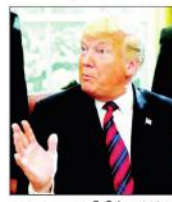
سعودی لیڈر نے منسلک افرون کیخلاف کارروائی کو بیزمنسنگ

سعودی لیڈر نے منسلک افرون کیخلاف کارروائی کو بیزمنسنگ واشنگٹن (ایجنسیوں) امریکی صدر ڈونلڈ ٹرمپ نے سعودی عرب کی حکومت کو وضاحت دینے کی کوشش کی ہے۔ ٹرمپ نے کہا کہ سعودی عرب کی حکومت نے اپنی تاریخ میں حقائق چھپانے کی سب سے بری کوشش کی ہے۔ ٹرمپ نے کہا کہ سعودی عرب کی حکومت نے اپنی تاریخ میں حقائق چھپانے کی سب سے بری کوشش کی ہے۔ ٹرمپ نے کہا کہ سعودی عرب کی حکومت نے اپنی تاریخ میں حقائق چھپانے کی سب سے بری کوشش کی ہے۔