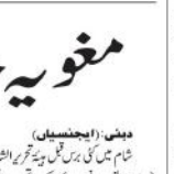
مغویہ جاپانی صحافی