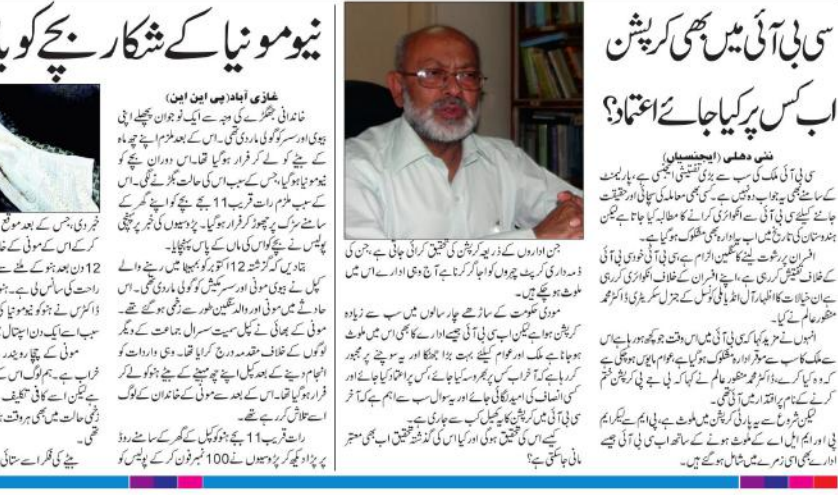
منشی دھلی (ایم جی ایم) نے کہا کہ گاندھی جی تمام ہندوستانی زبانوں سے یکساں محبت کرتے تھے: ڈاکٹر شری امر