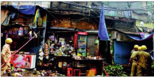
نئی دہلی کے کھانگ علاقے میں ایک مکان اور دوکان میں لگائی گئی گیس لائن۔