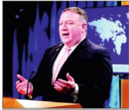
ایک سال پھر وزیر خارجہ میں سماجیوں سے مطالبہ ہے کہ پاکستان اپنی مغربی سرحد پر شدت پسندوں کے لیے محفوظ پناہ گاہیں نہ بنے۔

واشنگٹن (ایجنسیوں) امریکہ نے ایک بار پھر پاکستان سے مطالبہ کیا ہے کہ وہ افغانستان میں سرگرم شدت پسندوں کے خلاف کارروائی کرے۔ واشنگٹن کی وی بی سی میں سماجیوں سے گفتگو کرتے ہوئے امریکی وزیر خارجہ ٹرانک بلینک کا کہنا تھا کہ پاکستان نے اپنا سرگرم کردار ادا کرنا چاہیے اور امریکہ اس سے جوابی عملی کرے گا۔ انہوں نے کہا کہ امریکہ کا مطالبہ ہے کہ پاکستان اپنی مغربی سرحد پر شدت پسندوں کے لیے محفوظ پناہ گاہیں نہ بنے۔ بلینک کا کہنا تھا کہ پاکستان امریکہ سے پاکستان پرانی توقتا واضح واضح کیے اور اگر وہ اپنی توقتا پر پورا پورا تیار اس لیے اپنا عزم کی شدت پسندوں کے خلاف کارروائی کرنا ہے تو اس سے حساب لیا جائے گا۔ ایک سال پھر وزیر خارجہ