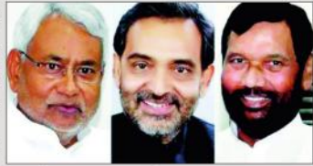
پتھہ (ایجنسیاں) بہار میں 40 لوگ سیٹوں کا اعلان ہوا ہے۔ این ڈی اے کے مطابق ہاؤس کے باقی 40 سیٹوں میں ابھی تک اعلان نہیں کیا گیا ہے۔

بے ڈی یو کے مطابق سیٹوں کا ہوا کر دیا گیا اعلان باقی، دیگر حلیف جماعتیں ایل پی پی اور اریل ایس پی کی تردید