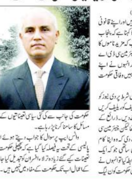
اسلام آباد (ایجنسیوں) سی ڈی اے کے چیئرمین اپنے موقف پر قائم قانونی مشیر کو ریلیو کرنے سے انکار

اسلام آباد (ایجنسیوں) سی ڈی اے کے چیئرمین اپنے موقف پر قائم قانونی مشیر کو ریلیو کرنے سے انکار اسلام آباد (ایجنسیوں) سی ڈی اے کے چیئرمین اپنے موقف پر قائم قانونی مشیر کو ریلیو کرنے سے انکار اسلام آباد (ایجنسیوں) سی ڈی اے کے چیئرمین اپنے موقف پر قائم قانونی مشیر کو ریلیو کرنے سے انکار