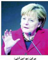
یورین وون ڈیر لےین

48 کراڑ امریکی ڈالر کے ہتھیار کی بات کی ہے۔ جرمنی نے سعودی کو ہتھیار فراہم کرنے سے انکار کیا ہے۔ جرمنی نے سعودی کو ہتھیار فراہم کرنے سے انکار کیا ہے۔