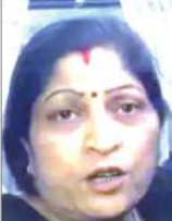
انھوں نے گاہا کر کے کوہا مارا۔ کھل سے بیٹے کی پھانسی کے پردہ ہاتھ

بیان دیتے ہوئے بیٹے کے پاس کروڑی۔ ایک منٹ کی مراثی کی ہے۔ اس آخری رسما کوہا کر لیتے ہیں