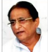
دام بود (عالمگیر ایم خان) رام چندر لاپڑی صاحب محلہ کھنڈیاں

گرمی راج کے تنازعہ بیان پر اعظم خاں کا تلخ سوال کابینہ وزیر اعظم خان نے دوگلوں تواپ کے لئے گرفتار کر کے خوشامد اطرا لیکر ہارواگ کہاں تھے گئے؟