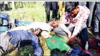
سہارنپور (یو این این) سہارنپور کے تالاب میں گرگنی ٹریکٹر ٹرائی کے دوران بچے کی موت ہوئی۔

کریلا۔ اس حادثہ میں سات سال کے ایک بچے سمیت سات افراد کی موت ہوئی۔