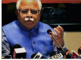
حصول (یو این اے)

وزیر اعلیٰ کی پڑوسی ریاستوں سے ہریانہ میں بسوں کی تعداد بڑھانے کی اپیل