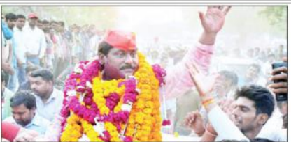
ہریاگ (یو این این) ساج دادی سنگھ مورچے اور ساج دادی پارٹی (اے پی ای) سے فوجیوں کو لوہیا کے نظریات سے بے پروا نہیں کیا جاوے گا۔ ساج دادی پارٹی نے کہا کہ جے پی اور لوہیا کے نظریات سے بے پروا نہیں کیا جاوے گا۔ ساج دادی پارٹی نے کہا کہ جے پی اور لوہیا کے نظریات سے بے پروا نہیں کیا جاوے گا۔

ساج دادی پارٹی چھوڑ کر ایس پی کا ساتھ نہیں لے سکتی۔ ایس پی کے نظریات سے بے پروا نہیں کیا جاوے گا۔ ساج دادی پارٹی نے کہا کہ جے پی اور لوہیا کے نظریات سے بے پروا نہیں کیا جاوے گا۔ ساج دادی پارٹی نے کہا کہ جے پی اور لوہیا کے نظریات سے بے پروا نہیں کیا جاوے گا۔