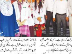
UDMA ڈے پریکٹس ری میڈیٹری کی شرکت

نئی دہلی (پریس ریلیز) - نئی دہلی میں سوہا کے پرنسپل آج کی صبح ہارن کالج اسکول کے نئی عمارت کا سنگ بنیاد رکھنے کے لیے حاضری ہوئی۔