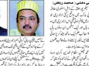
سیلم پور حلقہ میں واقع پرگتی لائبریری کو وسیع کرنے کا مطالبہ

نئی دہلی (پریس ریلیز) - نئی دہلی میں سوہا کے پرنسپل آج کی صبح ہارن کالج اسکول کے نئی عمارت کا سنگ بنیاد رکھنے کے لیے حاضری ہوئی۔