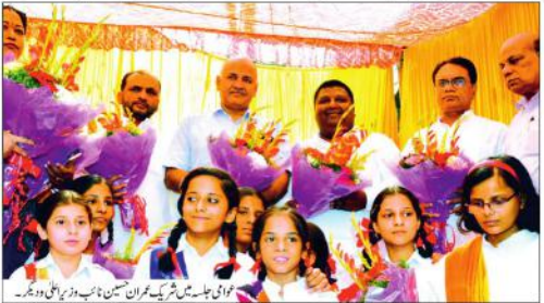
نئی دہلی (پریس ریلیز) - نئی دہلی میں سوہا کے پرنسپل آج کی صبح ہارن کالج اسکول کے نئی عمارت کا سنگ بنیاد رکھنے کے لیے حاضری ہوئی۔

نائب وزیر اعلیٰ کے ہاتھوں چشمہ بلڈنگ اسکول کی نئی عمارت کا سنگ بنیاد