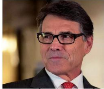
امریکی نے چین کو نیوکلیئر ٹیکنالوجی کی برآمدات محدود کرنے کا اعلان کیا ہے۔

ماسکو (ایجنسیاں) انٹرنیٹ ہو سکتا ہے 48 گھنٹوں کے لئے ٹھپ؟