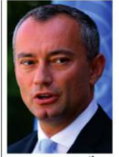
فلسطینی قیادت کا

اقوام متحدہ کے ایلپی کیسٹھ سے ایک کام کرنے سے انکار پروشلیم (ایجنسیاں) فلسطینی قیادت نے اقوام متحدہ کے خصوصی ایلپی کیسٹھ سے ایک کام کرنے سے انکار کر دیا ہے۔ فلسطینی قیادت نے ایلپی کیسٹھ سے ایک کام کرنے سے انکار کر دیا ہے۔ فلسطینی قیادت نے ایلپی کیسٹھ سے ایک کام کرنے سے انکار کر دیا ہے۔