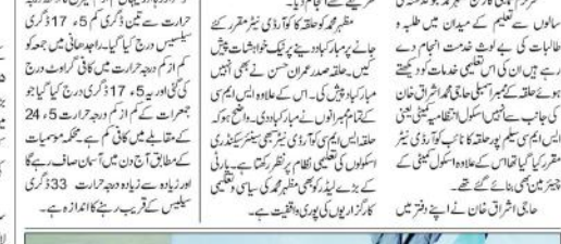
مظہر محمد حلقہ کے کوآرڈینیٹر مقرر

نئی دہلی (پریس ریلیز) - نئی دہلی میں سوہا کے پرنسپل آج کی صبح ہارن کالج اسکول کے نئی عمارت کا سنگ بنیاد رکھنے کے لیے حاضری ہوئی۔