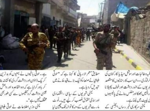
طالبان اور روسی میڈیا کارکنان کی گرفتاری، ان سب کا ساتھ ساتھ حوثیوں کے اندر دہشت اور خوف پھیلاتا ہے۔ یمنی فوجیوں کو دہشت زدہ کرنے کی کوششیں جاری ہیں۔