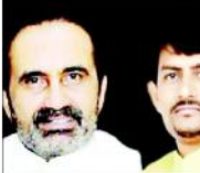
ایک شخص کا بیان، جو گجرات میں ہونے والے حملوں کے بارے میں بات کر رہے ہیں۔

پٹنہ (بی جے پی) - گجرات میں بہاریوں پر ہونے والے حملوں کے خلاف بی جے پی نے اپیش کو بدنام کیا ہے۔