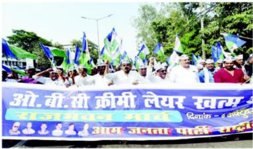
ایک سیاسی جلسے کا منظر، جہاں لوگ پرچمیں اٹھا رہے ہیں۔

پٹنہ (بی جے پی) - بہار کے وزیر داخلہ سشیل مودی کو بی جے پی کے کارکنوں نے ایک گاڑی پر سیاہی پھینکی اور اس کا جھنڈا دکھایا۔ سشیل مودی نے اس واقعے کو ایک سازش قرار دیا ہے۔