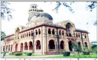
الہ آباد یونیورسٹی (اسے بی ڈی) (آزاد) چھترکار کھیتا کو 1952ء میں قائم کیا گیا۔

الہ آباد یونیورسٹی (اسے بی ڈی) (آزاد) چھترکار کھیتا کو 1952ء میں قائم کیا گیا۔ اس وقت اس میں تقریباً 774 ہزار طلبہ اور 3998 طلبہ ہیں۔ اس وقت اس میں تقریباً 774 ہزار طلبہ اور 3998 طلبہ ہیں۔ اس وقت اس میں تقریباً 774 ہزار طلبہ اور 3998 طلبہ ہیں۔