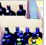
بہار میں برآمد ہونے والی شراب کے بوتلوں کا منظر۔

سہسرام (یو این آئی) - بہار میں کثیر مقدار میں شراب برآمد ہوئی ہے۔