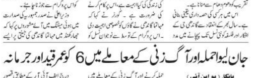
بھاکلا میں ایک عدالت کی نشست کا منظر۔

بھاکلا (یو این آئی) - جان لیوا حملہ اور آگ زنی کے معاملے میں 6 کو عمر قید اور جرمانہ دیا گیا۔