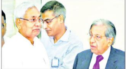
پٹنہ میں ایس ڈی اے کے ڈپٹی ایگزیکٹو ڈائریکٹر اور دیگر افسران کی فہرست تیار کرنے کے لیے میٹنگ

سماجی، اقتصادی اور ذات برادری کے سروے کی بنیاد پر مستفیدین کی فہرست تیار