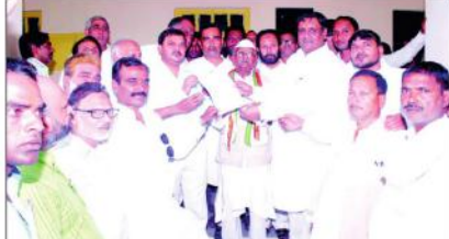
دیوبند (ضابطہ) بی این این (این) سابق ایم اے ایچ پی چوہدری کے تنگ کی قیادت میں کانگریس کارکنان نے اس ڈی ایم آر کو پیش کر کے اپنی اپنی پارٹی کے بانیوں کو ملے ہوئے ٹول ٹیکس ختم کرنے کے لئے کانگریس کے لئے ڈی ایم آر پیش کیا ہے۔ ان کے کانگریسیوں نے اس ڈی ایم آر کو گورنر اور پارٹی کے بانیوں کو پیش کیا ہے۔

کسانوں پر کٹے گئے لاٹھی چارج پر بی جے پی کو بتایا کسان اور عوام مخالف حکومت