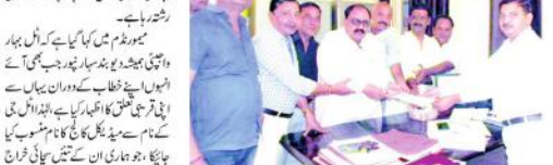
دیوبند (ضابطہ) بی این این (این) شیخ الہند کالج کا نام ٹل بہاری سے منسوب کرنے کا مطالبہ کیا گیا ہے۔