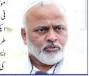
دلی میں (یو این این) آل انڈیا کانگریس صدر کے صدر اور سابق پارلیمنٹ ڈپٹی اسپیکر ڈاکٹر ایم اے اعجاز علی کے ساتھ

سیکولازم کا ڈھول پیٹنے والی طاقتوں کی مسلمانوں کے خلاف بیان دے کر اصل بات سے توجہ ہٹانے کی کوشش: ایم اے اعجاز علی