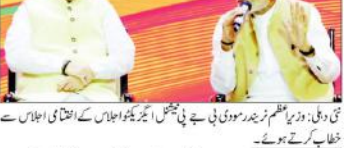
دہلی، وزیر اعظم نریندر مودی کی بے بی بی جے پی کے نعرے