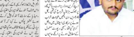
جمہا آباد (یو این آئی) بڑے زانہ کٹھوعہ آبروریزی کی رپورٹ میں