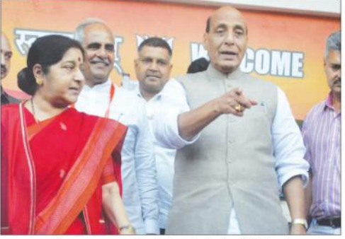
بی جے پی کی توہینوں کے خلاف ایک نیا گانہ گانے کے لیے بی جے پی کے کارکنوں کا اجتماع