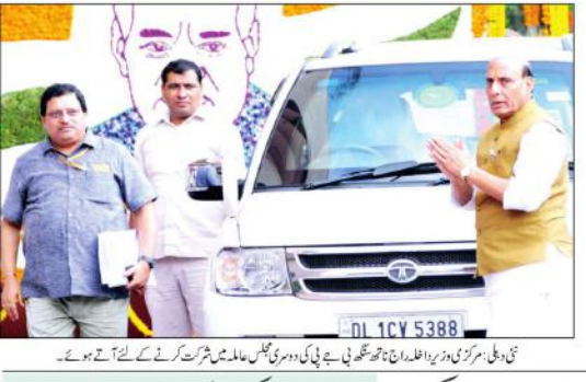
ٹی وی مرکزی ریڈیو اعلان کا صحیح ٹی وی بی بی سی دوسری مجلس ماملہ میں شرکت کرنے کے لیے آئے ہوئے۔