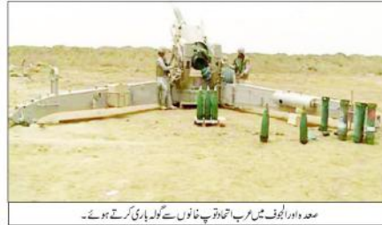
صعدہ اور الجوف میں عرب اتحادیوں نے باغیوں کو ہلاک کرنے میں کامیاب ہوئے۔

ہونے کے علاوہ قیدی بھی بنائے گئے۔ ان کے علاوہ... دہشت گردوں اور آل سعودیوں نے باغیوں میں کامیاب ہوئے۔