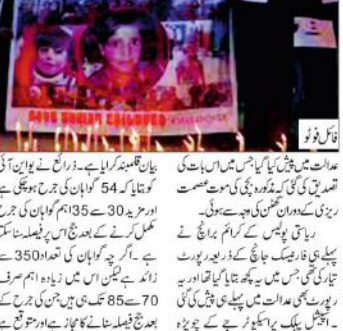
بڑے زانہ کٹھوعہ آبروریزی کی رپورٹ میں

جمنو (یو این آئی) بڑے زانہ کٹھوعہ آبروریزی کی رپورٹ میں