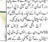
جمنو (یو این آئی) بڑے زانہ کٹھوعہ آبروریزی کی رپورٹ میں

دال میں کچھ کالا ضرور ہے۔ کانگریس میں کچھ کالا ضرور ہے۔