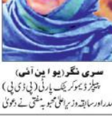
سوری شکر (یو این آئی)

کراچی کی شہریت اور جنوبی کشمیر کی شہریت کا فرق