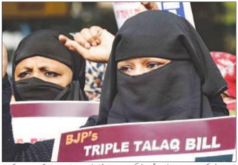
تین طلاق سے متعلق بل ایک سہ ماہی میں پاس ہو گیا ہے لیکن راجیہ سہا میں اپوزیشن پارٹیوں کی مخالفت کی وجہ سے اس بل میں ترمیم کی ضرورت ہے اور اس کے خلاف احتجاجی مظاہرے ہو رہے ہیں۔

آرڈیننس غیر آئینی: اویسی نئی دہلی، (یو این این) تین طلاق کو غیر آئینی قرار دینے والے آرڈیننس کے خلاف سپریم کورٹ نے ایک فیصلہ سنایا ہے۔ سپریم کورٹ نے آرڈیننس کو غیر آئینی قرار دیا ہے۔