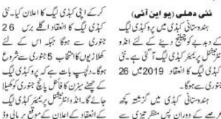
نئی دہلی (یو این این) پرو کبڈی لیگ کے کوچینج دینے کے لیے انڈیا نیشنل پری میئر کبڈی لیگ آئی ہے۔

پرو کبڈی لیگ کے کوچینج دینے کے لیے انڈیا نیشنل پری میئر کبڈی لیگ آئی ہے۔ پرو کبڈی لیگ کے کوچینج دینے کے لیے انڈیا نیشنل پری میئر کبڈی لیگ آئی ہے۔ پرو کبڈی لیگ کے کوچینج دینے کے لیے انڈیا نیشنل پری میئر کبڈی لیگ آئی ہے۔