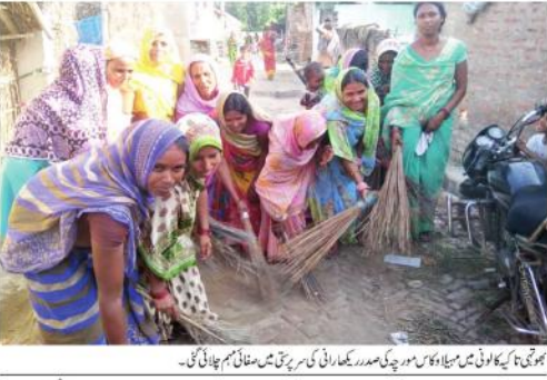
بھونگی کی کولونی میں میٹھا دکان پر چکی سمور دکانی کی سرپرستی میں مغالیم چلائی گی۔