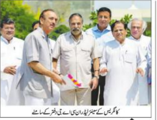
کاگر میں سے ستمبر ایڑیاں سے لے کر پھر کے سامنے

رافیل پہنچا سی اے جی کاگر میں نے کیا بدعنوانی کی جانچ کا مطالبہ 59000 کروڑ روپے کی معاہدہ کا ایک نیا سہ ماہی سے کیا گیا۔ رافیل کے معاہدے کے تحت سی اے جی کے ساتھ ایک معاہدہ پر دستخط ہوئے ہیں۔ اس معاہدے کے تحت سی اے جی کو 59000 کروڑ روپے کی رقم فراہم کی جائے گی۔