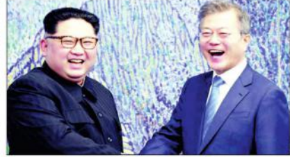
ایٹمی ہتھیار (یو این ایس) شمالی کوریا کے رہنما جیو جی اے اور جنوبی کوریا کے صدر مون جی نے ان کے شمالی کوریا کے دارالحکومت پیانگ یانگ میں ایک مشترکہ تقریب کے دوران مشترکہ طور پر دستخط کیے۔

ڈی پی سی۔ شمالی کوریا کے رہنما جیو جی اے اور جنوبی کوریا کے صدر مون جی نے ان کے شمالی کوریا کے دارالحکومت پیانگ یانگ میں ایک مشترکہ تقریب کے دوران مشترکہ طور پر دستخط کیے۔