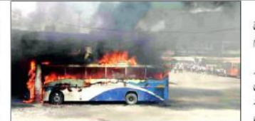
چونگی کے بس کے دونوں ڈرائیوروں اور لیکنر لیکنر خاتون نے آگ لگانے سے پہلے بس کو روکا۔

وادنسا (بی این این) - وادنگ راجبیکہ کی ایک ٹیکسٹائل فیکٹری میں لیکنر خاتون نے آگ لگانے سے پہلے بس کو روکا اور لیکنر خاتون نے بس میں آگ لگائی۔ لیکنر خاتون نے بس میں آگ لگانے سے پہلے بس کو روکا اور لیکنر خاتون نے بس میں آگ لگائی۔