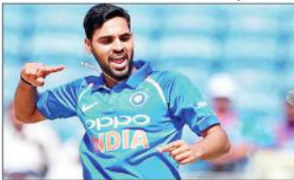
ابو ظہبی (ایجنسیاں) ایشیا کپ میں بھونیشور نے پاکستان کی بوتلی بند کرنے میں مدد کی۔

بھونیشور نے پاکستان کی بوتلی بند کرنے میں مدد کی۔ بھونیشور نے پاکستان کی بوتلی بند کرنے میں مدد کی۔ بھونیشور نے پاکستان کی بوتلی بند کرنے میں مدد کی۔