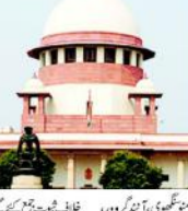
بھارتی عدالت نے ایودھیا میں جلد سے ہی ایک مندر کی تعمیر کا مطالبہ کیا ہے۔ بھاگوت نے کہا کہ ایودھیا میں جلد سے ہی ایک مندر کی تعمیر کا مطالبہ کیا گیا ہے۔

نئی دہلی (یو این این) بھارتی عدالت نے ایودھیا میں جلد سے ہی ایک مندر کی تعمیر کا مطالبہ کیا ہے۔ بھاگوت نے کہا کہ ایودھیا میں جلد سے ہی ایک مندر کی تعمیر کا مطالبہ کیا گیا ہے۔ بھاگوت نے کہا کہ ایودھیا میں جلد سے ہی ایک مندر کی تعمیر کا مطالبہ کیا گیا ہے۔