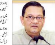
نئی دہلی (یو این آئی) ری۔ پی۔ ایف۔ کے خلاف پابندی لگائی گئی ہے۔

بھارتی عدالتوں کے لیے ری۔ پی۔ ایف۔ کے خلاف پابندی لگائی گئی ہے۔