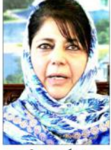
سری سونیا گاندھی (یو این آئی) سونیا گاندھی نے سونیا گاندھی کو مبارکبادیں پیش کی اور کہا کہ وہ ان کے لیے ایک نیا پیترا بن سکتی ہیں۔

نئی دہلی (یو این آئی) کشمیر میں مرکزی حکومت کی طاقت پر مبنی پالیسی ناکام ہے۔ محبوبہ مفتی نے کہا کہ ان کے لیے جو اقدامات کیے گئے ہیں، ان کے نتیجے میں صورتحال ابتر ہو رہی ہے۔