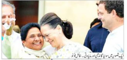
ایک تصویر میں سونیا گاندھی اور مایاوتی۔ فائل فوٹو میلے میں ہیں۔ سونیا گاندھی اور مایاوتی نے ایک مشترکہ تقریب میں شرکت کی۔ مایاوتی نے سونیا گاندھی کو مبارکبادیں پیش کی اور کہا کہ وہ ان کے لیے ایک نیا پیترا بن سکتی ہیں۔

دو ماہ بعد، جیتا جی کی رہائی کے لیے مایاوتی نے سونیا گاندھی کو مبارکبادیں پیش کی اور کہا کہ وہ ان کے لیے ایک نیا پیترا بن سکتی ہیں۔ مایاوتی نے سونیا گاندھی کو مبارکبادیں پیش کی اور کہا کہ وہ ان کے لیے ایک نیا پیترا بن سکتی ہیں۔