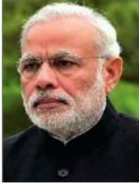
نئی دہلی (یو این آئی) وزیر اعظم نرندرا مودی نے اے جے ماکن کی صحت مند ہونے کی امید ظاہر کی۔

اے جے ماکن کے جلد صحت مند ہونے کی امید ظاہر کی۔ وزیر اعظم نرندرا مودی نے اے جے ماکن کی صحت مند ہونے کی امید ظاہر کی۔