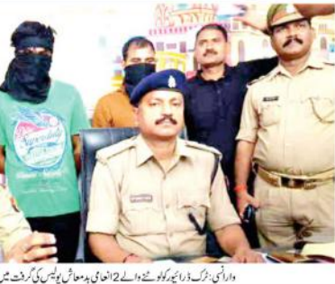
واریسی بزرگ ذرا بعد پورے ہوئے۔ 2 دنہی دماغاتی پھینک کر گرتے ہیں۔