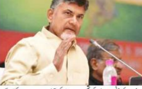
نئی دہلی (یو این آئی) چندرا بوبو ٹیڈ وکوعدا (ت) میں حاضری سے چھوٹ ہے۔