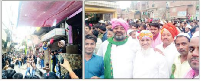
نئی دہلی (محمد ریاض) یوم عاشورہ کے موقع پر محرم کی 10 تاریخ کی رات کو قریب اداچی پورے پیکے سپر کے قریب جاتی عبادت میں واقع قبرستان امام زادہ کی عین میں یا حسین یا حسین کی صداؤں سے بھر پور جلوس نکلا۔

یا حسین یاعلی کی صداؤں سے یوم عاشورہ کی فضا سگوار