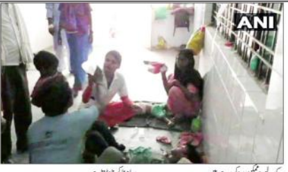
ماہی بخار سے متاثر۔

موت ہو گئی ہے۔ ان دنوں ماہی بخار سے متاثر 73 بچے شام ہیں۔ اس سے قبل سے ہی ماہی بخار سے متاثر 68 بچوں کی آئی ہے۔ لیکن ابھی تک پورے نہیں ہوئے۔