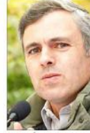
نئی دہلی (یو این آئی) دفعہ 35A ہٹائی گئی تو درخ کا زیادہ نقصان ہے۔